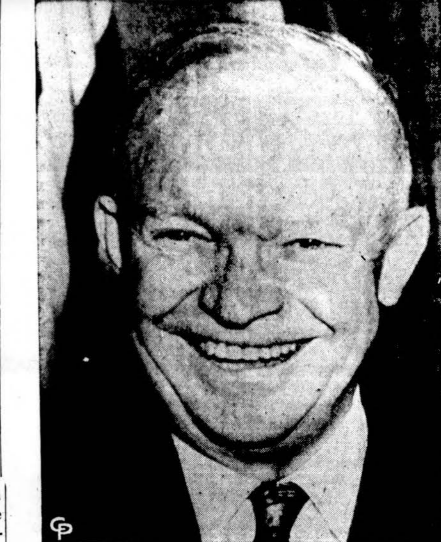
Prezidentas Eisenhoweris patenkintas gydytojų pranešimu, kad jo sveikata yra gerame stovyje. Sveikatos sustiprinimui prezidentas išvyko poilsio į Georgia valstybę.