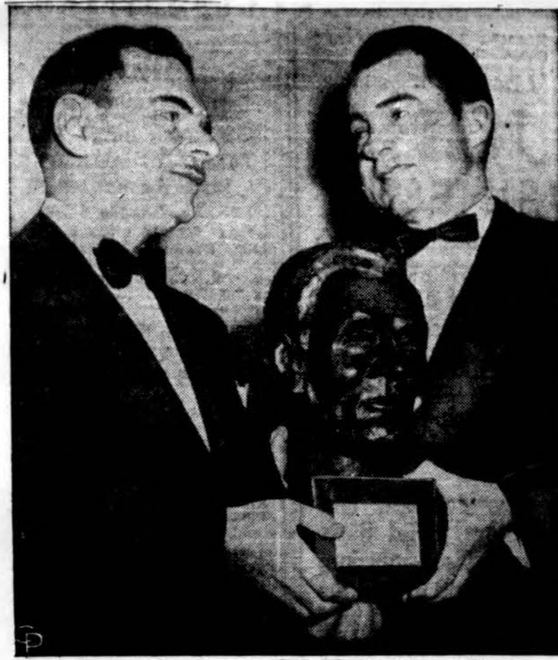
Thomas E. Dewey įteikė JAV viceprezidentui Richard Nixonui Abrahamo Lincoln bronzinį galvą pietų metu, New York'e. Pietus suruošė Respublikonų klubas.