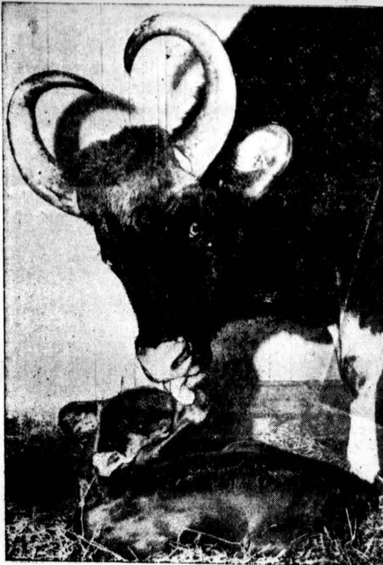
Laukinis buivolai (gauras), 19 metų, iš pietryčių Azijos, Washingtono zoologijos sode. (INS)