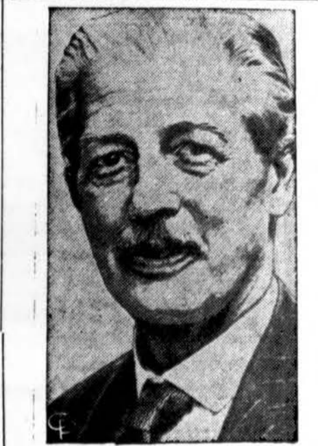
Anglijos išdo kancleris Macmillan, pateikęs parlamentui infliacijos su-laikymo programą.

• Brazilijos prezidentas išpėjo tautą, kad krašto ūkinė padėtis yra labai rimta. Reikės didesnių mokesčių ir didesnio darbin-gumo.