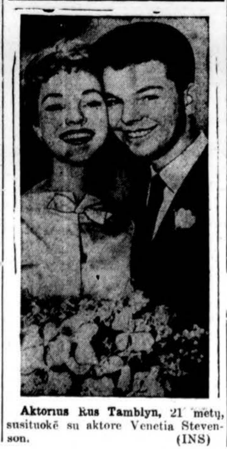
Aktorius Rus Tamblin, 21 metų, susituokė su aktore Venetia Stevenson.

Vandens sporto mėgėjai ir žiemą kur palei Chicago prasi-kereta eketę ir apsilvėkę gumini-ais nardžiais, apsaugojančiais juos nuo šalčio, naudoda-mi kaukes, aprūpintas deguo-nimi, nardo po vandeniu.