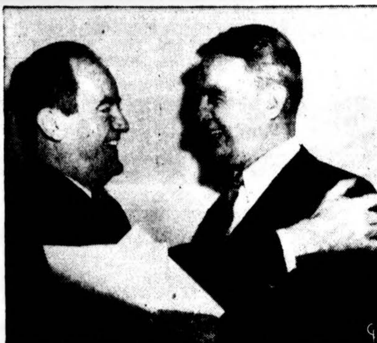
Demokratų senatoriai Hubert H. Humphrey (kairėje) Minnesota, ir Stuart Symington, Missouri, džiaugiasi Washington, kad prezidentas Eisenhoweris vetavo natūralių dujų įstatymą. (193)

linė aplinka. Vyrai ir merginos dažnai yra priversti gyventi bendrose patalpose. Tikintieji neturi jokios galimybės pasinaudoti dvasiniais patarnavimais. Persikėlimas į Kazachstano plėšinius ir Rusijos miškus Lietuvoje jauniui yra surištas su didžiausiais pavojais. Jo ten laukia ne kas kitas, kaip medžiaginis ir dvasinis skurdas. Ten patekęs mūsų jaunimas gali ne tik žūti Lietuvai, bet pražudyti ir savo sielą materializmo bei nedorovės tamsoje.