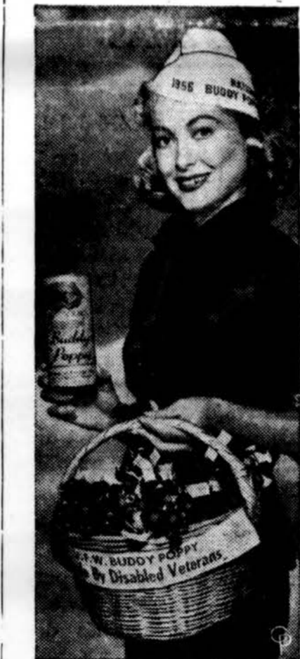
Aktorė Lori Nelson išrinkta Hollywoode 1956 m. "Buddy Poppy Girl". Ji pagelbės užsieniui karų veteranams aukų vajuje.

Vasario 17 d. iš pat ryto enkavedistų viršininkas pasišau-