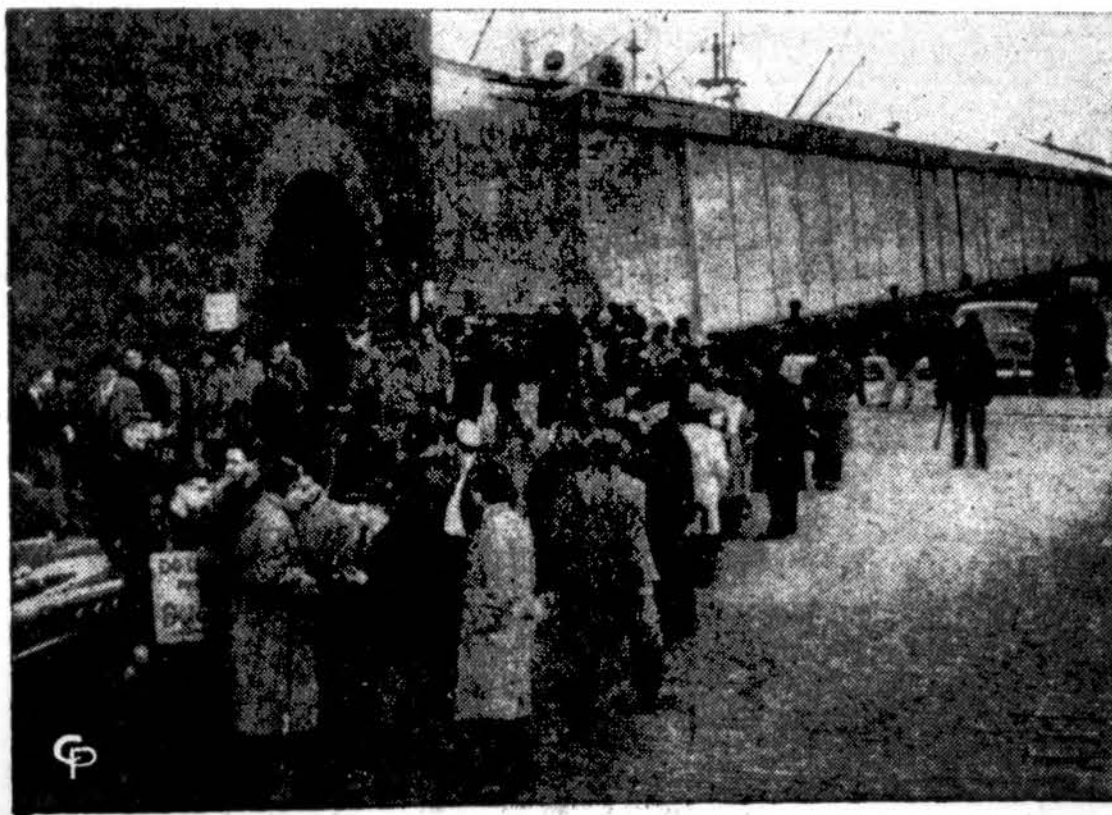
New Yorko ir Brooklyno žydai piketuoja ošte, protestuodami tankų išvežimą Saudi Arabijon. Jiems nepasisekė laivą sulaukyti — jis išplaukė vakar su 18 tankų į paskyrimo uostą.