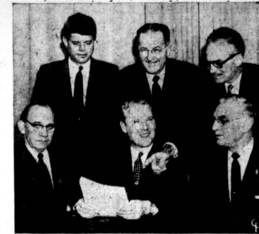
Šie senatoriai ir dar du tirs iš šono daromą spaudimą į kongreso narius, kad būtų pravesas ar numarintas tas ar kitas įstatymo projektas. (INS)

Lietuvos žmonių ryžtingumas ir drąsa yra pavyzdys laisvam pasauliui. Jie primena mums,