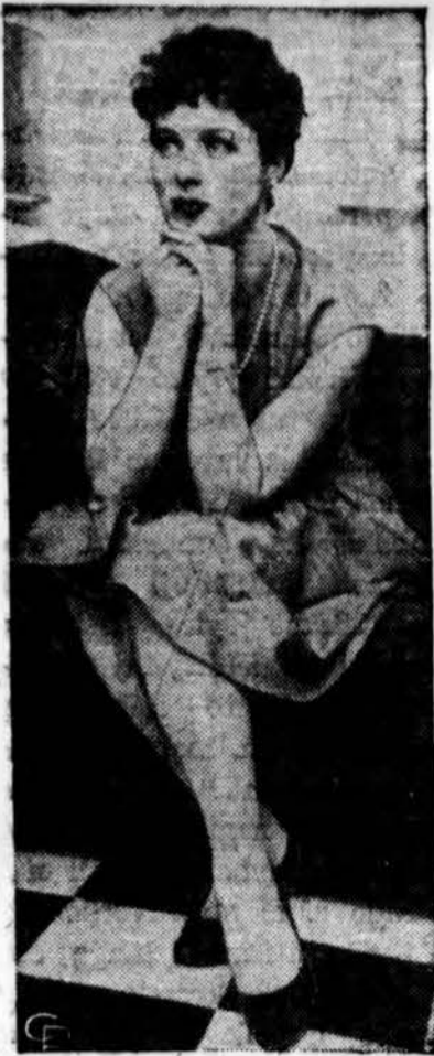
Aktorė Rita Gam savo apartamente New Yorko mieste. Ji patvirtino žinią, kad Grace Kelly pakvietė ją būti vyriausia pamegė jos vedybės su Monaco prinču Rainier.