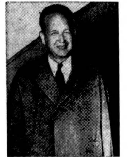
Dag Hammarskjöld, Jungt. Tautų gen. sekretorius, grįžo apkeliaves Azijos ir Vid. Rytų kraštus. Jam atrodė, kad žydai ir arabai padarys taiką.

— Visa Izraelio spauda piketai komentuoja Foster Dulles pareiškimus, kad ginklai nėra Izraelio išgelbėjimas.