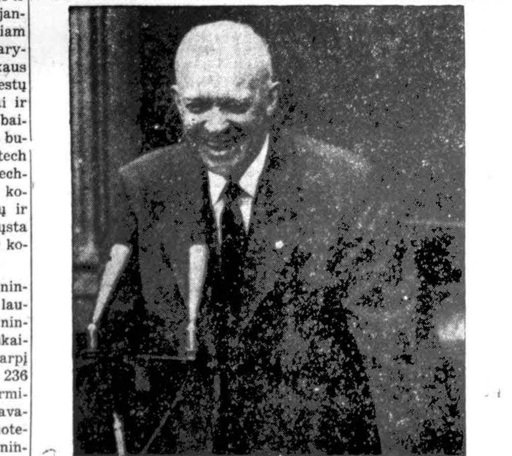
Prez. Eisenhoweris tuo momentu, kada pranešė apie apsisprendimą siekti antro termno. (LNS)

Kiek apsiniaukus, temperatūra apie 50 laipnių. Saulė teka 6:26, leidžiasi 5:42.