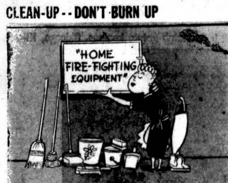
NATIONAL BOARD OF FIRE UNDERWRITERS CLEANING OUT COMBUSTIBLE RUBBISH IS A GOOD WAY TO HELP PROTECT YOUR HOME AND FAMILY FROM FIRE.

CLEAN-UP -- DON'T BURN UP "HOME FIRE-FIGHTING EQUIPMENT"