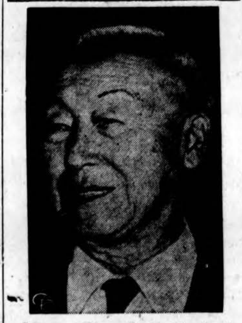
Syngman Rhee, P. Korėjos kovin-gasis prezidentas, pranešė nebenu-ris prezidentanti.

Demonstrantai prašė nepriklausomybės ir ispanų Marokui, bet ispanai šūkavimus užbaigė ginklų ugnimi.