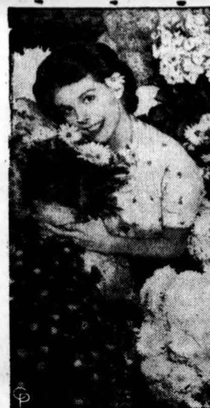
Aktorė Betsy von Furstenberg tarp gėlių. 39-ta Tarptautinė gėlių paroda prasidės kovo 11 d. New York, N. Y.