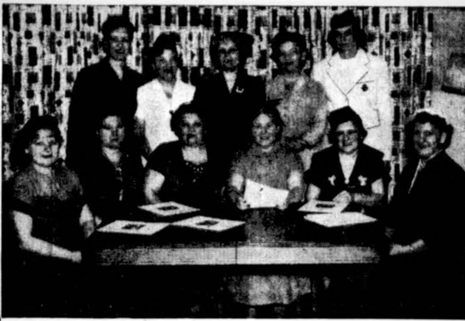
Darius ir Girėno Legiono Moterų Auxiliary kovo 11 d. 2:30 val. p. p. rengia įdomią madų parodą ir kortų pramogą ("Fashion show and card party"). Pramoga bus Darius ir Girėno salėje, 4416 South Western Ave.