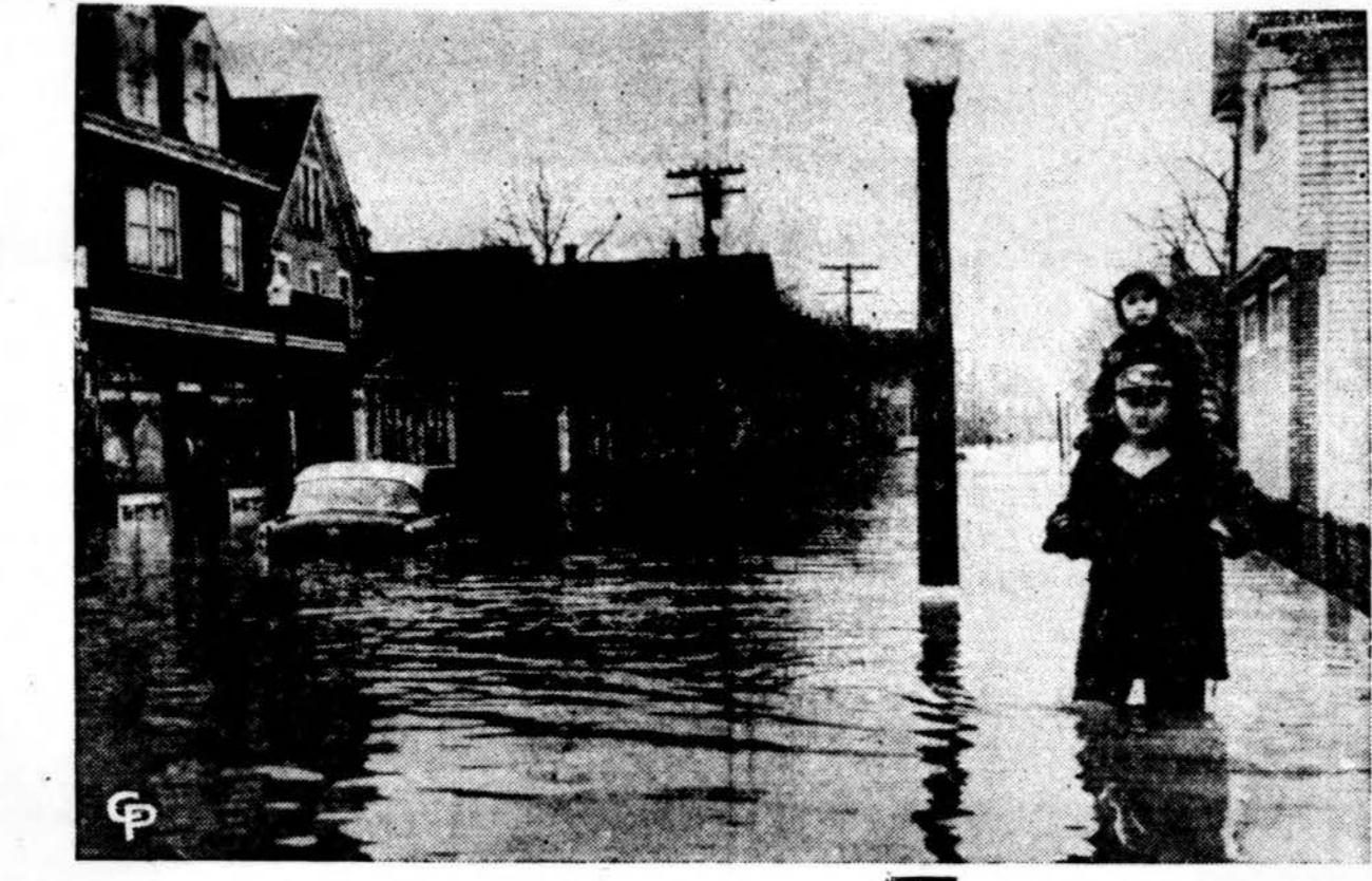
Vienur viesulas, kitur potvyniai. — Kai krašto vidurvakariuos paskutiniem dienom daug eibių pridarė viesulas, rytiniėje krašto dalyje stipriai lijo ir daug kur aptvino gyvenvietės. Čia matomas apsemtas Laekwana miestelis New Yorko valstybėje.

Kukurūzai reikalingi nuolatiniams, daug laiko atimantiems, priežiūros labai stigo. Lietuvos partcentro komitetas viename savo pareiškimė, tarp kito ko, sako („Tiesa“, 1955. VIII. 4 d.): „Tuo metu, kai daugelyje šalies rajonų kukurūzų auginimui išskirtas plotas, tarybiniai ūkiai — 17,000 ha. Abejotina, ar likusioji kukurūzų auginimui išskirto ploto dalis laikui dar buvo apasėta kitomis kultūromis. Greičiausiai daug kur buvo palikta dirvonuoti.“