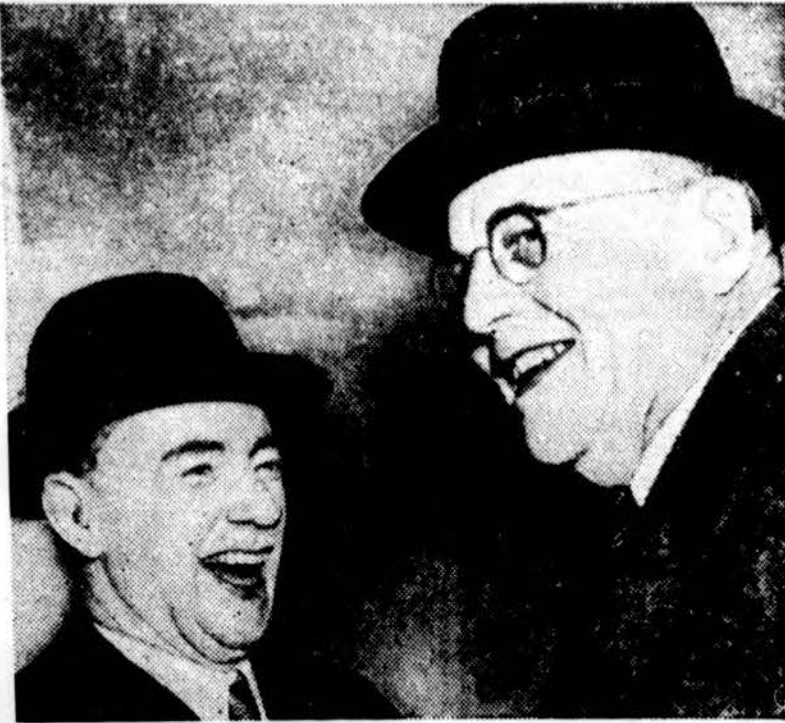
Valstybės sekretorius John Foster Dulles išvyko į Aziją, kur išbus 19 dienų. Žiūrintis į Dulles yra Sir Percy Spender (kairėje), Australijos ambasadorius JAV. Valstybės sekretorius Dulles dalyvavo pietryčių Azijos sutarties organizacijos 8 tautų užsienio reikalų ministerių suvažiavime, įvykusiame Karachi, Pakistane.