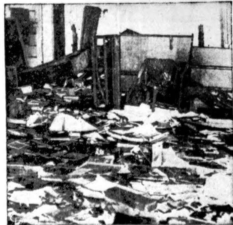
Taip atrodo prancūzų kolonistų sudaužytas ir sujauktas Amerikos konsulasat Tunisė.

— Prancūzijos užsienio reikalų ministeris ir Egipto premjeras aptarė vakar ginklų davimo Izraeliui reikalą.