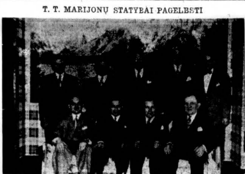
Sv. Antano Loan and Savings Assn., Cicero, Ill., direktoriai pagelbsti Tėvus Marijonams statyti vienuolyną ir "Draugo" spaustuvię. Jie nupirko Statybos fondo banketo 10 biety. Banketas bus kovo 18 d. 6 val. Sherman viešbutyje.