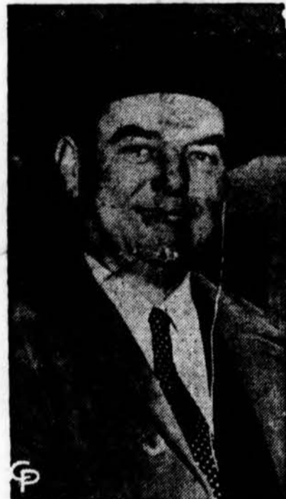
Foster Dulles pavaduojas paskelbė retorius Hoover vadovuoja JAV pastangoms Kipro krizę švelninant.

Tokį užtikrinimą gavo Londonas, kuris susijaudino gavęs iš Atėnų Amerikos ambasadoriaus pareiškimą, kurio viename sakinyje būta žodžio, iš kurio pada-