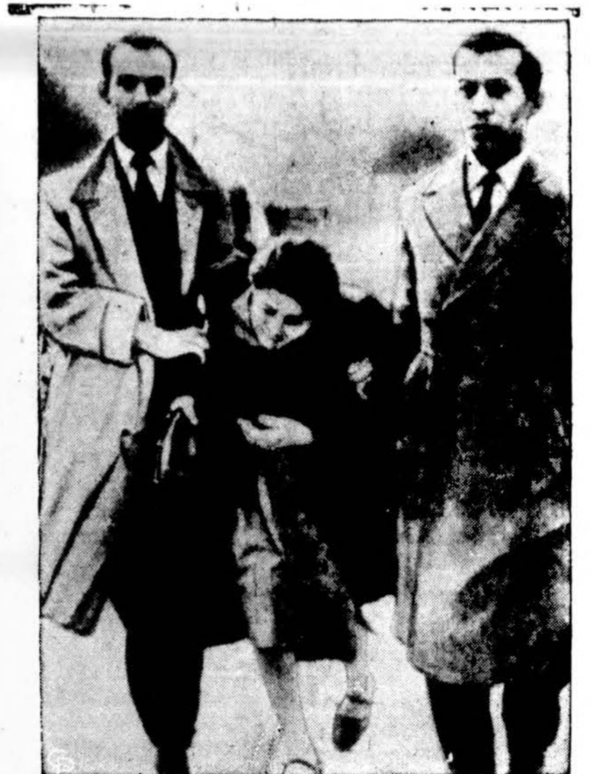
Moteris sužeista riaušėse, kurios kilo prieš britus Atenuose. Da vyrai sužeistą moterį veda iš riaušių scenos.

Betgi daugiausia aukų A. L. K. Federacija sudėjo kovodama už Lietuvos laisvę, už lietuviš- kumo išlaikymą. Per $0 metų šioje srityje ji veik sau lygį neturi. Jau pirmajame jos kon- gresė buvo siunčiami protes- tai prieš anų laikų sumanymus apkarpyti Lietuvos sritis, jun- giant jas prie kitų valstybių.