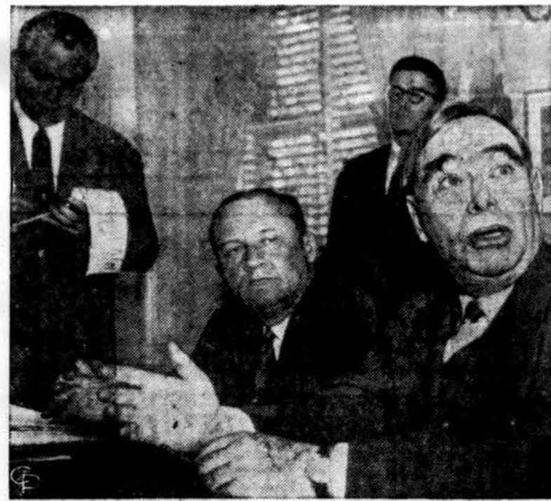
JAV Senate respublikonų vadas William F. Knowland (kairėje) iš Kalifornijos, ir Joseph W. Martin (R.), iš Massachusetts, Atstovų rūmų mažumos vadas Baltuose Rūmuose. Knowland pareiškęs spaudos atstovams, kad prezidentas Eisenhower vetuos ūkio reikalams įstatymą, jei jame įstatymas bus pasiūstas tokioje formoje, kokią priėmė Senatas.