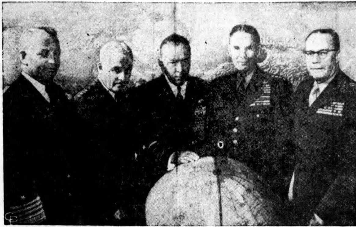
Amerikos generalinis štabas. — (Iš kairės dešinėn žiūrėti): laivyno operacijų viršininkas admiralas A. A. Burke, aviacijos štabo viršininkas gen. Twining, štabo viršininkų pirmininkas adm. Radford, armijos štabo viršininkas gen. Taylor, marinių korpo komandantas gen. Pate.

Prie kiekvieno žodyno, kaip ir prie visų knygų, yra skolinimo kortelė su vieta datai ir pavardei. Ir prie žodynų esančios kortelės dar visiškai svarutės: jokios datos, nei pavardės. Matyt, žmonėms dar nebuvo prireikę lietuvių kalbos. Bet negalima būtų sakyti, kad politinė medžiaga apie Lietuvą nebūtų kam buvusi reikalinga. Anų knygų kortelėse apstu pavardžių ir tarnautojai nė kiek nesistebi, jei tokios kny-