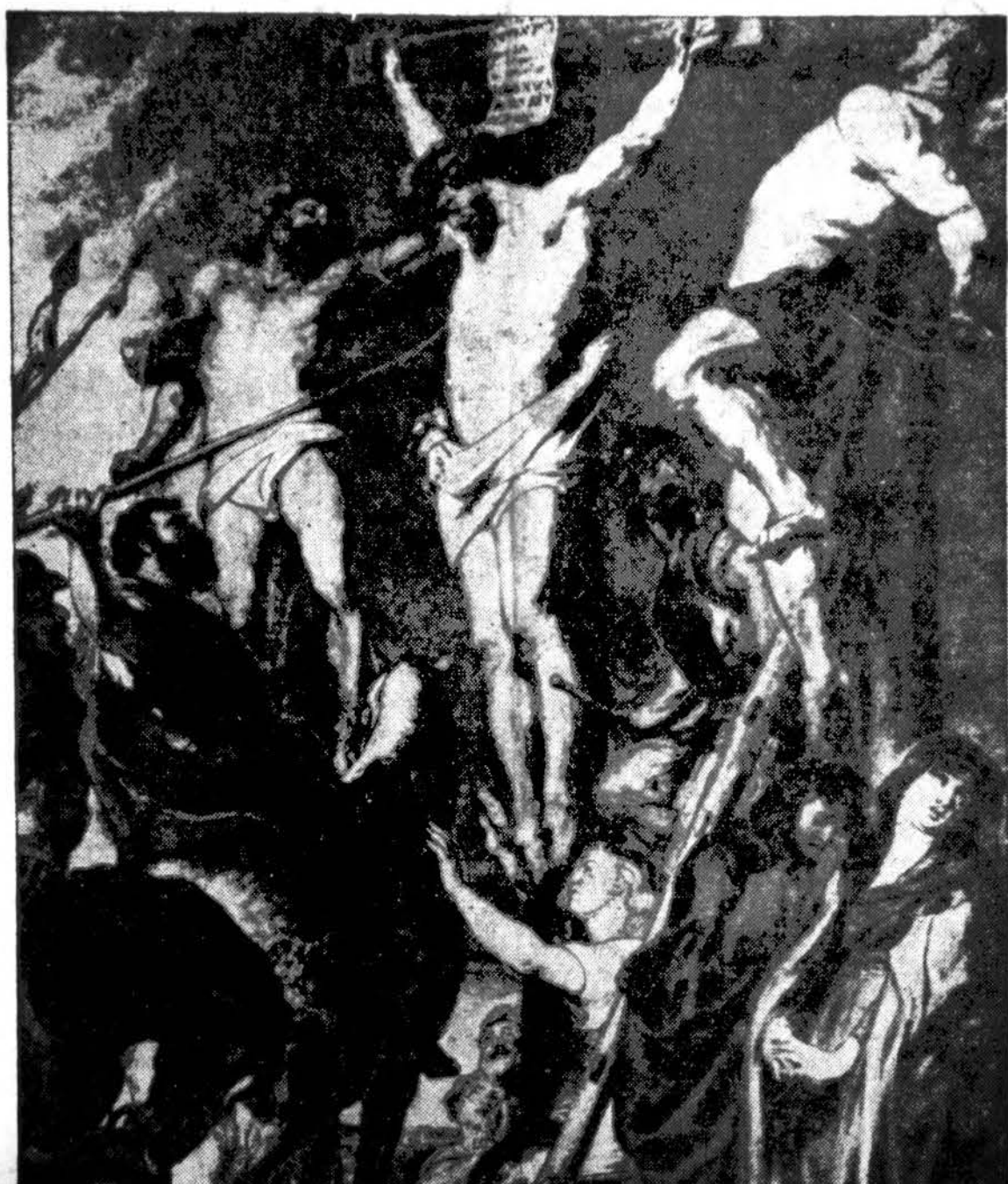
Jėzus Kristus mirtis. — Jėzus buvo prikaltas prie kryžiaus kartu su dviem galvažudžiais. Nuo šeštos valandos pasidarė tamsu visoje žemėje iki devintai valandai. Apie tą valandą Jėzus sušuko dideliu balsu, sakdamas: Mano Dieve, mano Dieve, kam mane palikai! Kaikurie, prie kryžiaus buvo ėmė iš Kristaus tyčiotis, actu girdyti, o jis antrą kartą saukdamas dideliu balsu atidavė dvasią. Tada perplyšo šventyklos uždanga, žemė sudrebėjo, nolios suskilo, kapai atsidarė ir daug šventųjų kėlėsi iš numirusiųjų. Simfionikas nusigandęs tarė: Tikrai šitas buvo Dievo Sūnus.

• Prie Meksikos krantų sudėję ir paskendo Meksikos laivas. Yra žuvusių keleiviu.