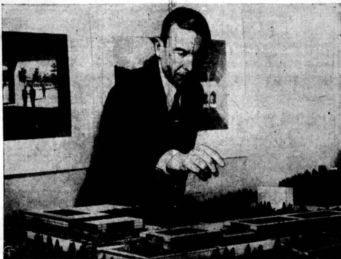
JAV oro jėgų sekretorius Donald Quarles rodo oro jėgų saugumo projektą. Akademinis bus statoma netoli Colorado Springs, Colo.

Tikrumoje MTS įpareigojamos nuo šio rūpintis ir prievolių iš kolchozų išreikalavimu dėl to, kad siekiama greičiau tas prievoles išreikalauti.