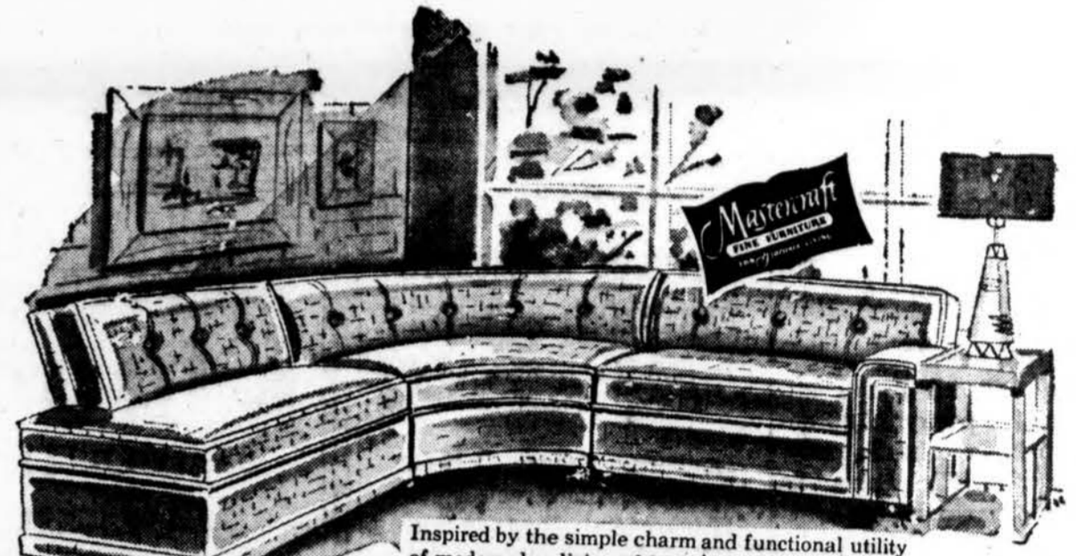
Inspired by the simple charm and functional utility of modern day living, this grouping by MASTER-CRAFT will truly be a room-arranger's delight. See it in a color assortment as varied as the rainbow.

VISA TAI KAS NAUJAUSIA BALDŲ PASAULYJE RASITE PAS MUS!