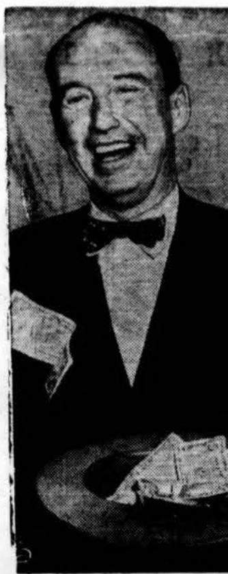
Adlai Stevenson laiko skrybėlę su dolerinėmis, kurias sudėjo asmenys norintieji jį pamatyti. P pinigai naudojami rinkiminei kampanijai.