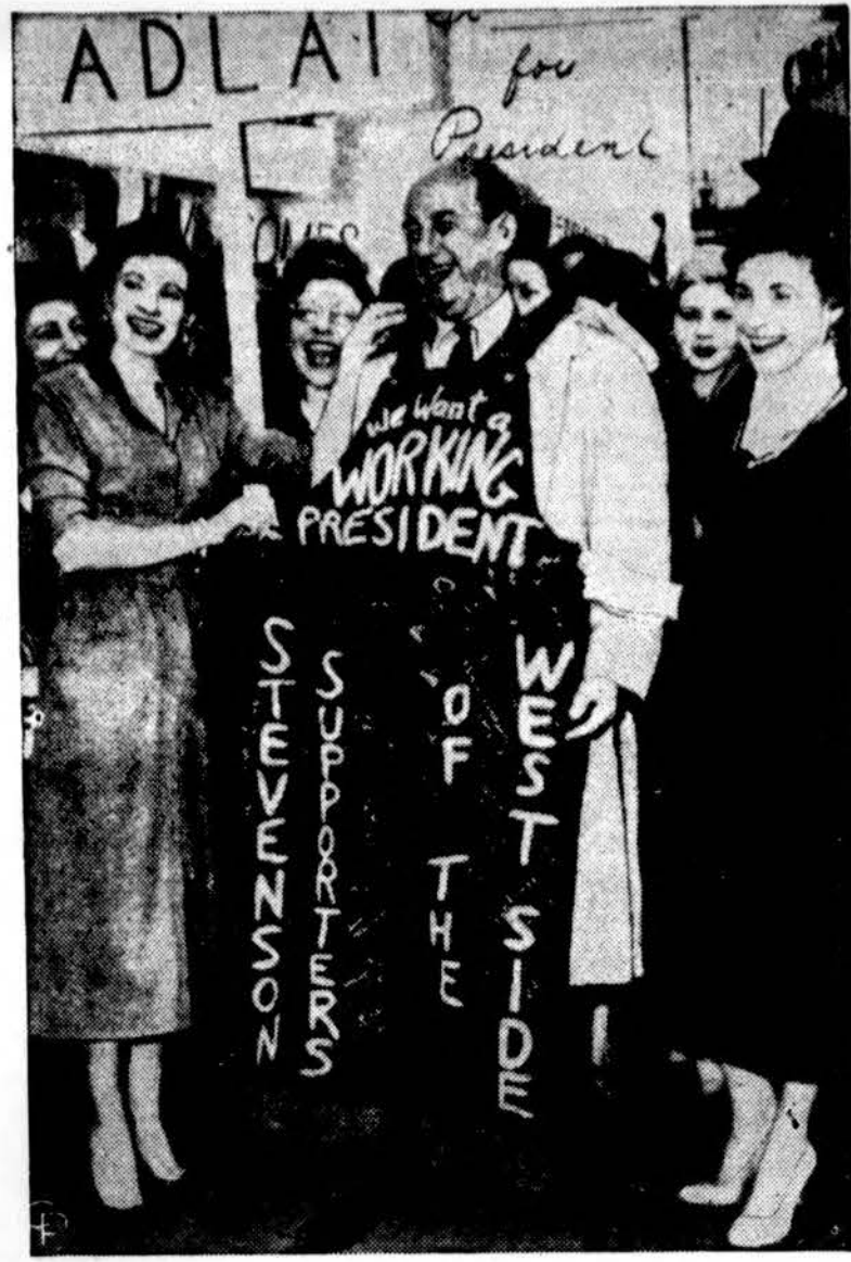
Adlai Stevenson La Guardia aerodrome gauna darbo drabužius vykdyti priešinkiminei kampanijai.