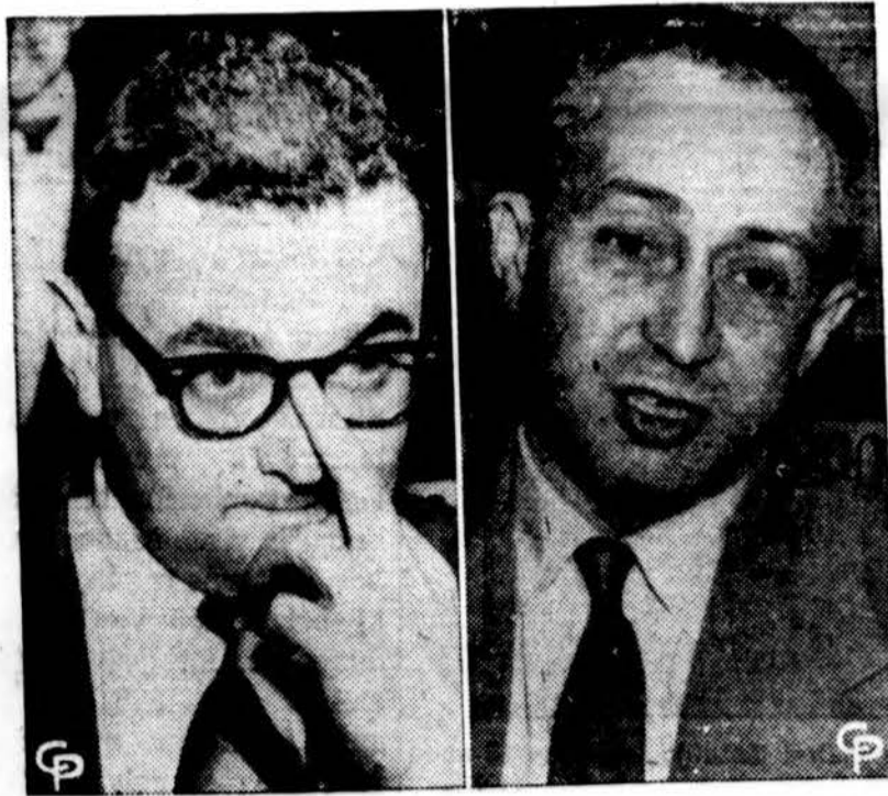
Atomo šnipai D. Greenglass ir H. Gold, kurie nuteisti Rosenbergo byloje, liudija senate saugumo subkomitete apie Sovietų spionažą.