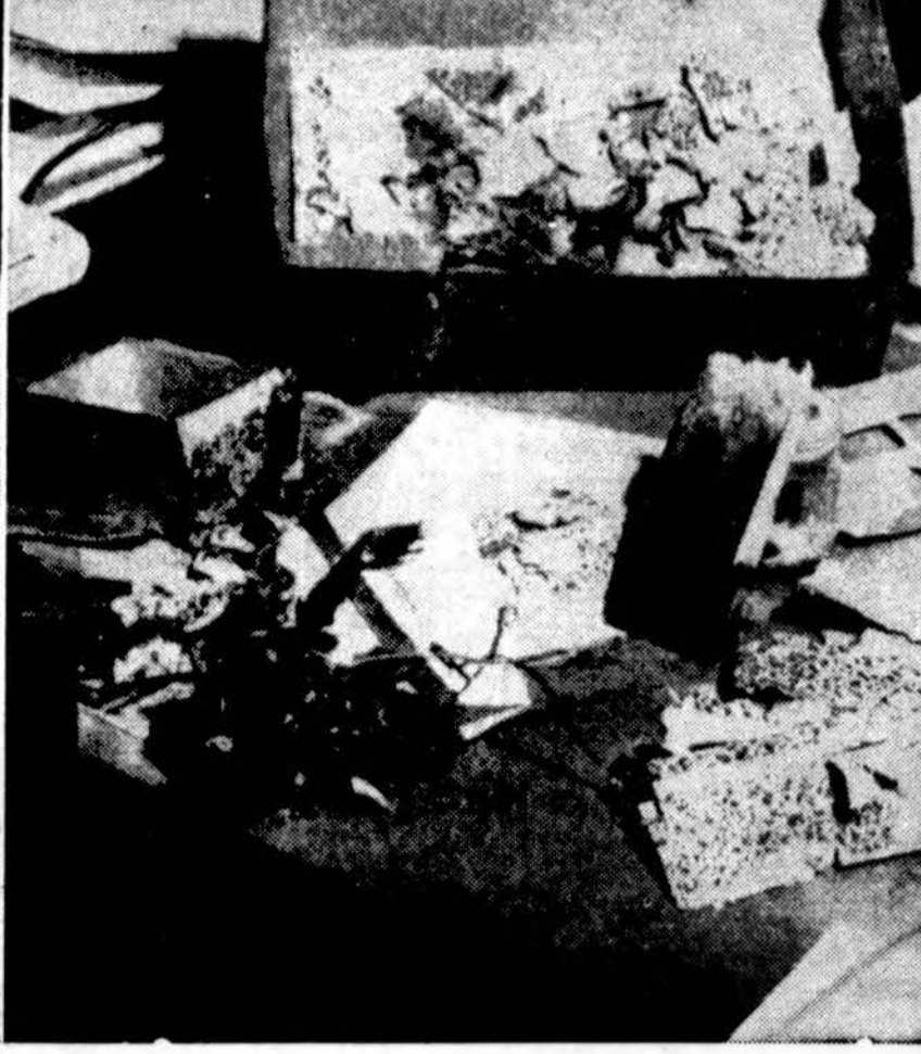
Jaunavedžiai manydami, kad tai vestuvinė dovana atidarė siuntinį, kuriame buvo bomba. Bomba sprogo ir sužeidė jaunąjį ir dar 4 asmenis. Už va landos turėjo būti valstybėje.

bė imtis žygių, kad būtų sustabdytas Pabaltijo valstybių naikinimas, kad būtų panaikintos priverčiamųjų darbų stovyklos, kur kenčia tūkstančiai nekaltų lietuvių, kad lietuvių nebūtų persekiojami savo krašte dėl tautinių ir religinių įsitikinimų, kad būtų atidaryta sienas, skirianti mūsų kraštą nuo laisvojo pasaulio, kad Vakarų pasaulio žurnalistai galėtų laisvai lankyti Pabaltijo valstybes ir teikti žinias apie tų kraštų gyvenimą.