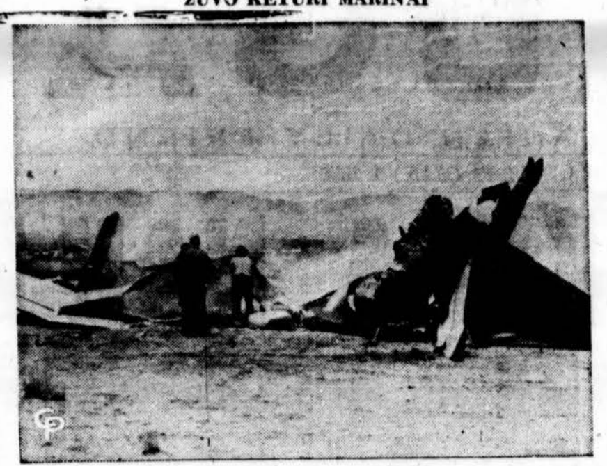
Keturi marinai žuvo susidūrus lėktuvams Mojave, Calif.