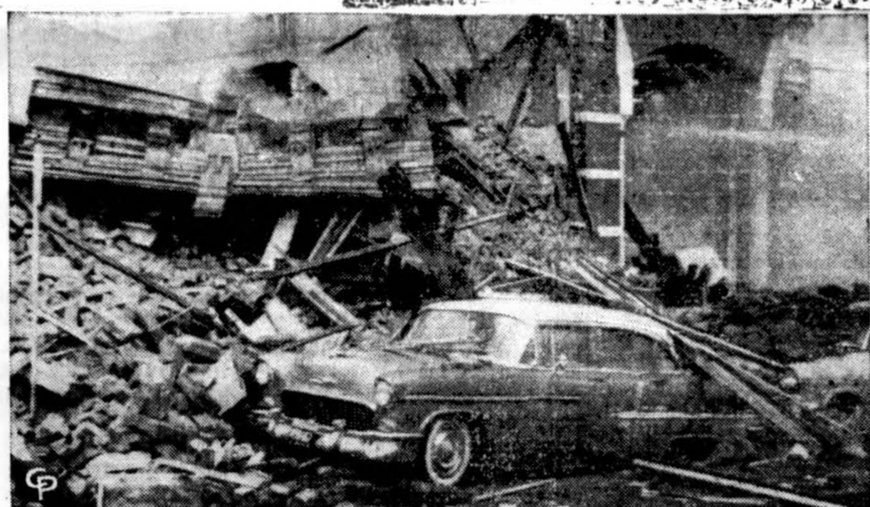
Dešimt žmonių žuvo apartamentiniame pastate per sprogimą Pulaski, Va.

savo kareivių aprūpinimui, o kai kur, naujai išlaisvintose vietovėse, leides net patiems kariams laisvai "pašeimininkauti" tų prklų tarpe.