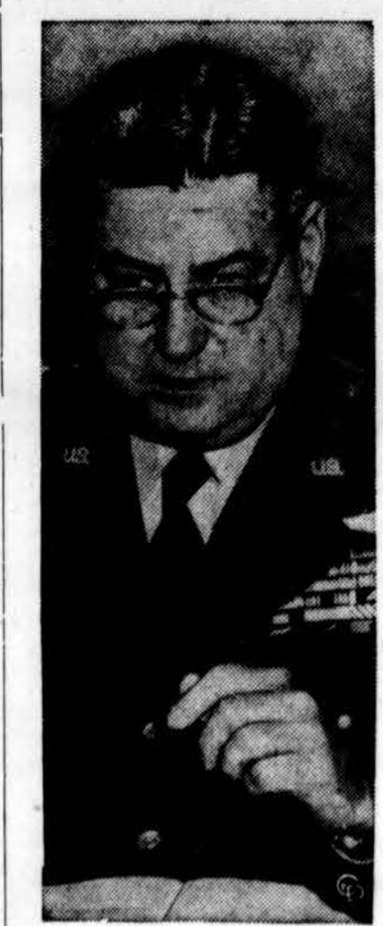
Gen. Curtis E. Le May, strateginės oro komandos vadas, kalbėjo Senato ginkluotų jėgų tarnybos pakomitečio posėdyje apie JAV oro jėgų stiprumą. Generalas pareiškė, jog didžiausia problema yra stoka oro jėgose išlavintų ir profesionalių vyrų.