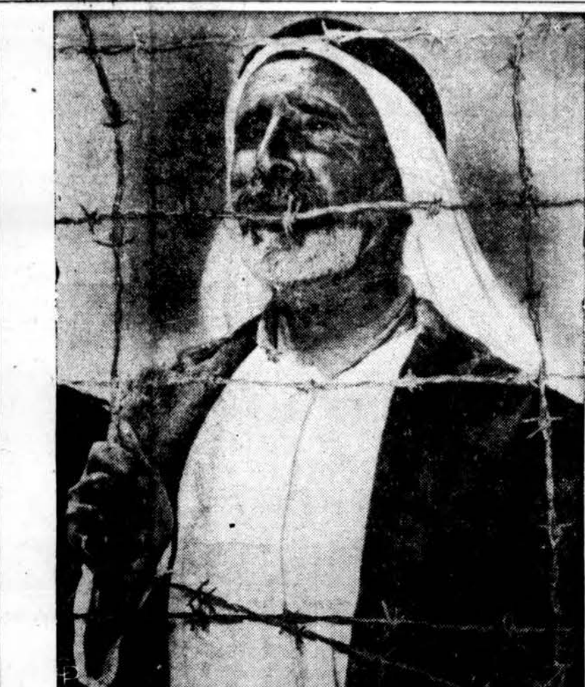
Arabas žiūri pro spygliuotų vielų užtvaną į savo tėviškę, esančią Izraelyje. Jis yra vienas iš 17,000 arabų tremtinių vienoje stovykloje, esančioje Gaza ruože.

• Turkai dabar kelia riaušes Kipro saloje. Turkų jaunuoliai padegė devynis graikų namus.