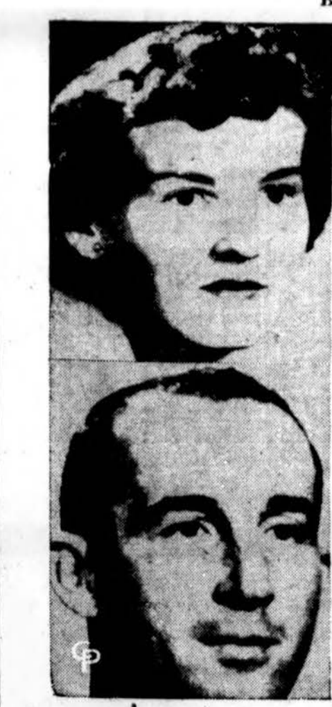
Jaunavedžiai manydami, kad tai vestuvinė dovana atidarė siuntinį, kuriame buvo bomba. Bomba sprogo ir sužeidė jaunąjį ir dar 4 asmenis. Už va landos turėjo būti valstybėje.

MENO VADOVYBĖ Meno vadovas BALYS PAKSTAS Montažo režisorė S. PIPIRAITĖ-TOMARIENĖ Kanklių vadovė A. KIRVAITYTĖ Tautinių šokių vadovės O. BLANDYTĖ B. BLANDYTĖ-LAURUSONIENĖ S. PIPIRAITĖ-TOMARIENĖ Akompagnatoriai J. KUTKUVIENĖ P. KUNTSMANAS