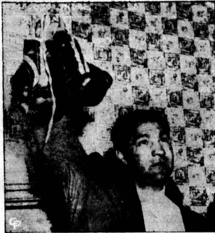
Boksininkas Rocky Marciano ne nugalėtas pasitraukia iš bokso pasaulio.