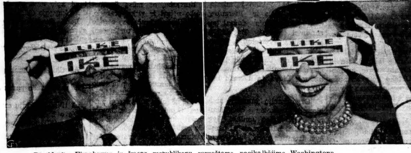
Prezidentas Eisenhower ir žmona respublikonų suruoštame pasikalbėjime Washingtone.