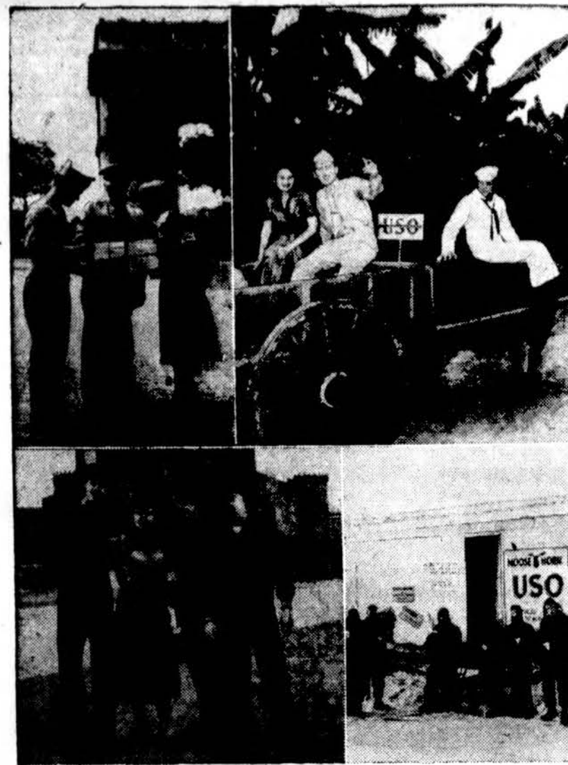
USO organizacija, padedanti Amerikos kariams kultūringai praleisti laiką, yra įsteigusi visame pasaulyje, kur tik yra amerikiečių karių, 227 klubus. Čia matome vaizdus iš Paryžiaus, Manilos ir Aliaskos.

mu klaidų laiką, daugelio tautų sunaikinimą ir visų religijų persekiojimą;