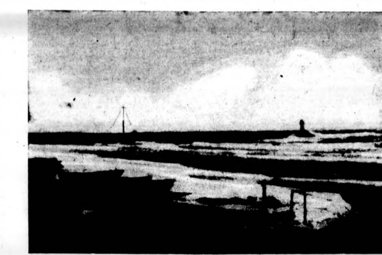
Turbūt, girdėjai tu, kad mariose Baiti laivai linguoja plaukia. O gal kur tolimam krante į delnus veidas neriasi, — Tai motinos, kuri sūnaus nebesulaukia... A. Miškinis

Minėjimo proga išleista leidinėlė, kuriame gausu žinių apie klubo ir jo padalinį veiklą. Pailiustruotas vieneto fotografijomis. Tame pat leidinėlyje pasiskelbė daug vietos biznierių, tuo pačiu paremdami šeštuosius metus pradėjusį Sporto Klubą. Minėjimo dieną klubiečių komanda sužaidė draugišką runktynes su Toronto Sporto Klubu "Aušros" futbolininkais. Klubu pagrindu yra buvusi