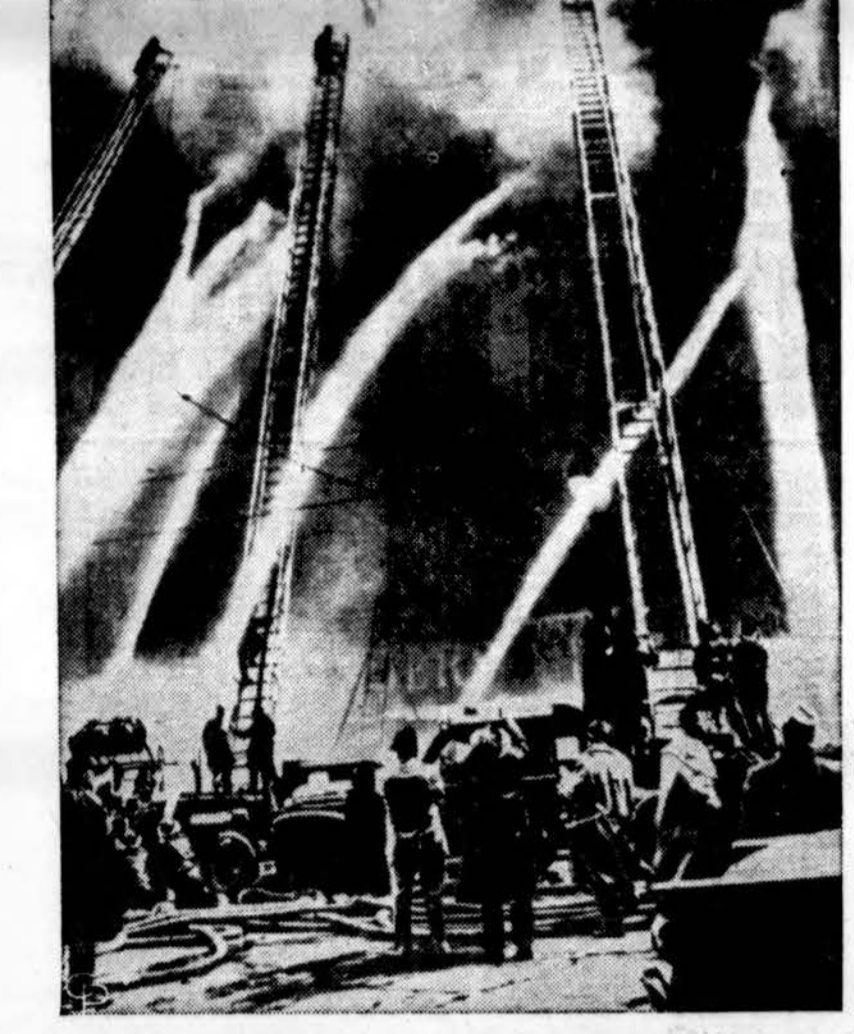
1 milijoną dolerių nuostolio padarė gaisras Detroitė, sunaikindamas drabužių ir kitokias krautuves ir sandėlius, šešių aukštų pastata.