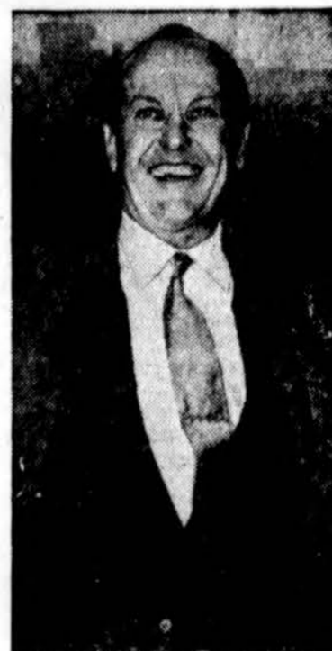
William Randolph Hearst, jr. Hearsto laikraščių vyr. redaktorius, atsilankė pas prez. Eisenhowerį Baltuosiose Rūmose. Hearst pareiškė, jog jis įsitikinęs, kad Chruščevas ir Bulganino atsilankymas Anglijoje sugadino sovietų reikalus.

Tokiais neapdairiais žurnalistais komunistai naudoja savo propagandai užsieniuose.