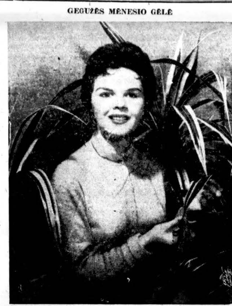
Chicago Parkų distrikatas skelbia, kad gegužės mėnesio gėlė yra parinkta gėlė iš Pietų Jūros salų, populiariai vadinama Screw-Pine, kadangi jos lapai sukasi apie kamieną. Jos lapai išmarginti baltais ir žaliais dryžiais.

Mokinys peršovė mokytoją. Prevate, 15 m. mokinys, peršovė mokytoją (viršuje) Cameron, Maryland Park augš. mokykloje, Seat Pleasant, Md. Mokytojas kritiškai padėję.