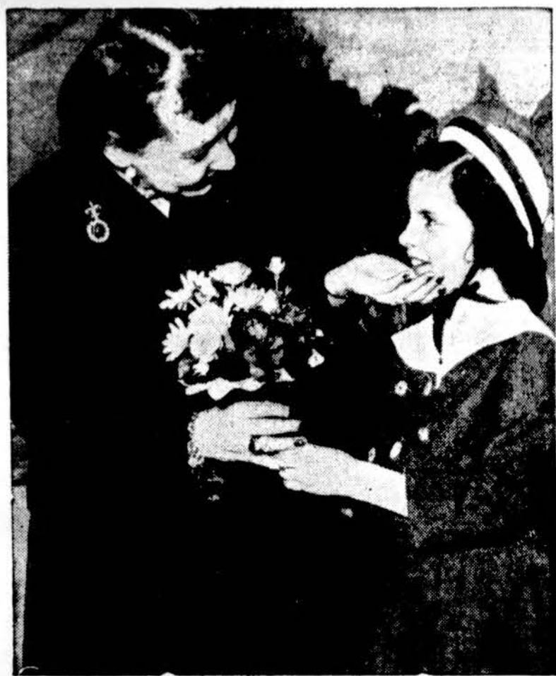
Aštuoniometė mergaitė iš Detroito įteikia puokštę gėlių ponai Eisenhower Washington, ryšium su 28 National Hearing savaitė, gegužės 6-12 d.

pati tauta šiandien yra nepajėgi kovoti), vienijus visas kovojančias institucijas ir visus užsilikusius valstybinius postus šioje svarbioje tautai kovoje — norima vienam atsisotci kovos priešakyje, paneigiant visus kitus.