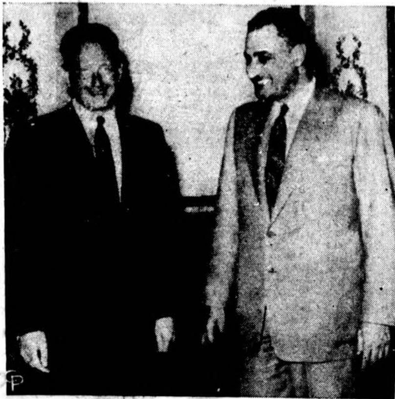
Jungtinių Tautų generalinis sekretorius Dag Hammarskjöld (kairėje) ir Egipto premjeras Gamal Abdel Nasser šypsosi po pasiekimo nesisaizymo sutarties tarp Egipto ir Izraelio. Dag Hammarskjöld jau grįžo į New Yorką iš Vidurio Rytų, kur taikė Izraelį su Arabų valstybėmis.

Šiaurės Atlanto Paktui dar reikalinga gero maisto PARYŽIUS, geg. 7. — Šiaurės Atlanto Sutarties organizacijos (Nato) penkiolika užsienio reikalų ministrų praėjusį sekmadienį išvyko namo. Jie kartu su savim išsivežė Jungtinių Amerikos Valstybių pasiūlymą, kad komitetas ar kabinetas sudarytų koordinacinį ekonominį ir politinį planą. Praėjusio sekmadienio ryte dar posėdžiavo Amerikos Valstybės sekretorius John Foster Dulles, Britanijos užsienio reikalų sekretorius Selwyn Lloyd ir Prancūzijos užsienio reikalų ministris Christian Pineau. Jie sutarė, kad Jungtinių Tautų Saugumo taryba yra tinkamas vežimas nuvesti taiką į Vidurio Rytus.