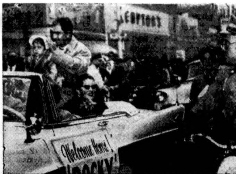
Boksininkas Marciano iškilmingai sutinkamas savo mieste Brockton, Mass.

Naumiestyje keturi. Už tat žydus nuo šaligatvių išjungdamas juos iš prie krautivių belaukiančių eilių, neleidavo jų į omnibusus ir apšaukdavo juos viešai "žydais" ir "parkomis". Tuomet daugelis žydu susidar draugai ir dabar vėl pradėjo lietuvius orientuoti. Antisemitizmas vėl atslūgo, bet už koliojimą "žydu" niekas atsakomybėn nebetraukia.