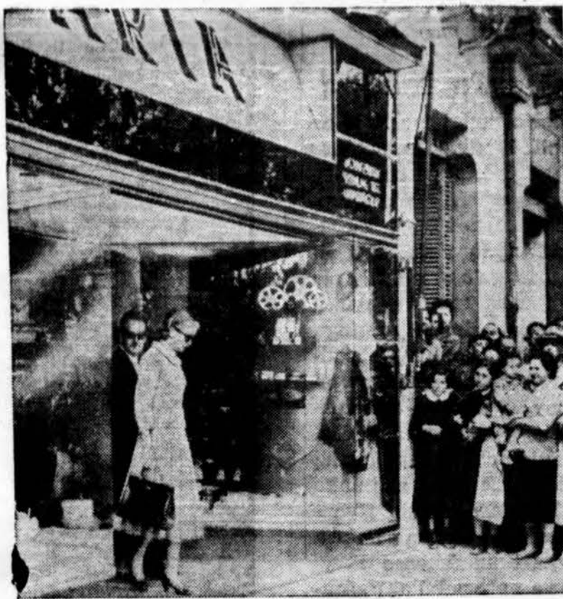
Princas Rainier III su žmona Grace vaikšto po kratutuves Palme de Mallorca, Balerae saloj.

mleji pažadėjo savo talką. Šio nelengvo darbo talkininkais turi likti visi Chicagoje lietuviai.