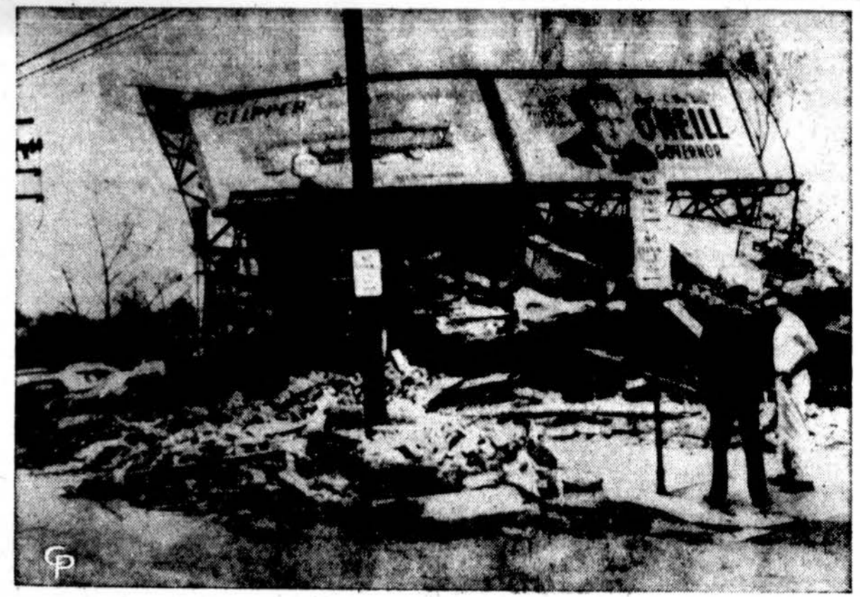
Keletas žmonių žuvo ir virš 200 sužeista kai stiprus viesulas perėjo Clevelandą.

Maskvos didžioji ofenzyva jau davė kaikiurių laimėjimų. Ceilonas, iki šiol buvęs Vakarų draugu, didele balsų dauguma išsirikino Maskvai palankų parlamentą. Burmoje Vakarų įtaką baigia išstumti visokia Maskvos technikinė ir personalinė pagalba. Arabai, Egipto vadovaujami, dideliais šuoliais ugdo istorinį savo nacionalizmą, de ja, su rausvu atspalviu. Cia Kremlius kaip uraganas prasi veržė į Vakarų gynybos užnugarį pro NATO ir SEATO neefektingą užtvaną. Netgi Europos širdyje Prancūzijos politikai vadai tokias nuomones reiškia, kad iš Kremliaus susilaukia entuziastingo pagyrimo. NATO narių posėdžiai Paryžiuje turėtų įlieti naujo kraujo į šio ligo nių gyslas. Prie viso to galima pridurti, kad iš Pietų Amerikos į Odesą atplaukė laivas su 800 repatriantų (jų tarpe keletas lietuvių), kurie liko sužavėti saldzijų Maskvos žodžių. O ramūs Islandijos gyventojai manė, kad jie bus saugesni, jei JAV atitrauks savo aviacijos