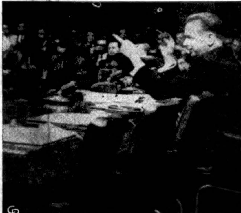
Jungtinių Tautų generalinis sekretorius Dag Hammarskjöld suruošė pirmąją spaudos konferenciją New Yorke, grįžus jam iš Vidurio Rytų, kur jis buvo nusiųstas taikinti Izraelio ir Arabų valstybes.

RABAT, Marokas, geg. 14. — Keturiolika tūkstančių marokiečių kareivių šiandien įžengė į Rabat, minint Maroko armijos gimtadienį.