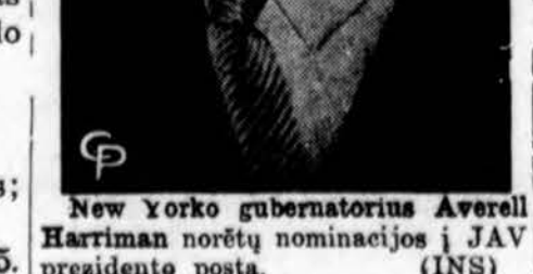
New Yorko gubernatorius Averell Harriman norėtų nominacijos į JAV prezidento postą.

Oro biuras praneša: Chicagoje ir jos apylinkėje rytoj bus didelis apsiniauėjimas ir šilčiau.