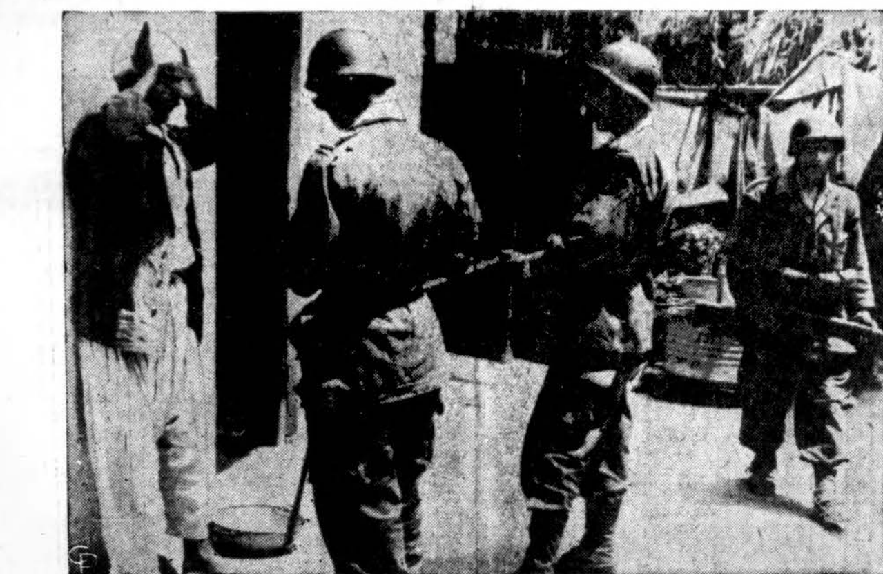
Prancūzai ieško ginklų Alžire. Alžirietis pastatytas prie sienos su iškeltomis rankomis, o prancūzas karveivis tikrina jo dokumentus. Prancūzai ieško ginklų pas Alžire gimusius gyventojus. Alžiro sukilėliai gyvai veikia prieš prancūzų kariuomenę.

— Į Vakarų Vokietiją iš JAV atsųsta didelis kiekis ginklų.