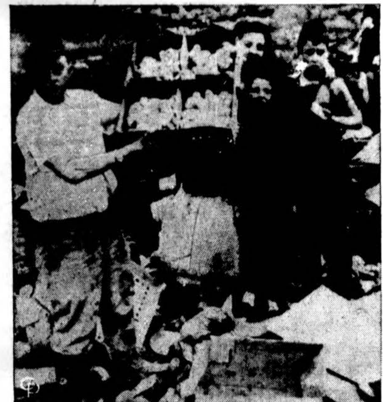
Prąšius tornadui Windsor, Ont., buvo nušluota šalin 100 viščiuku, kurie vėliau buvo surinkti ir kurių nė vienas nesužeistas.