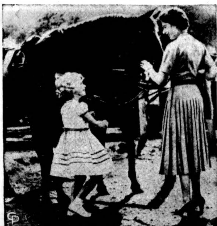
Princesė Anne, karalienės Elzbietos duktė, kalba su motina Windsor, Anglijoje, kur jos stebėjo, kaip tėvas, Edinburgo kunigaikštis, dalyvavo polo turnyre.