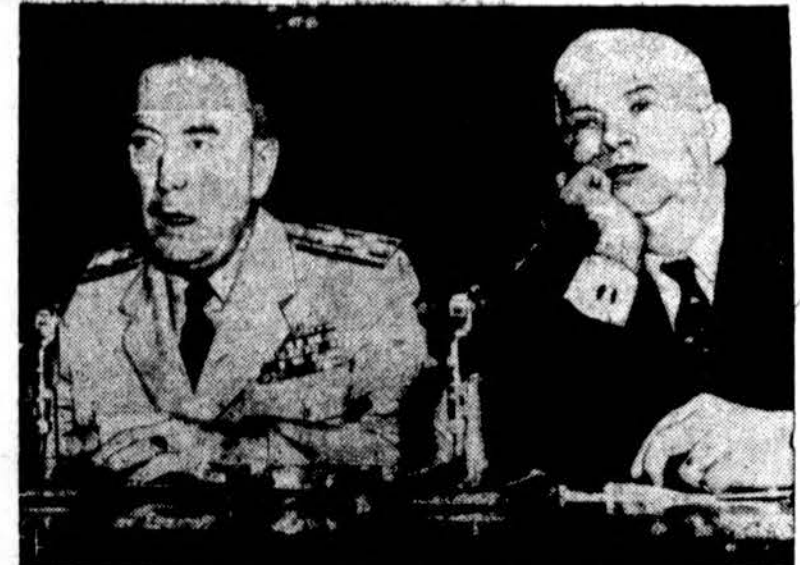
Adm. Arthur Radford sako, kad Amerikos oro jėgos gali pirmauti prieš Rusijos oro jėgas. Šalia gynybos sekretorius Wilson.