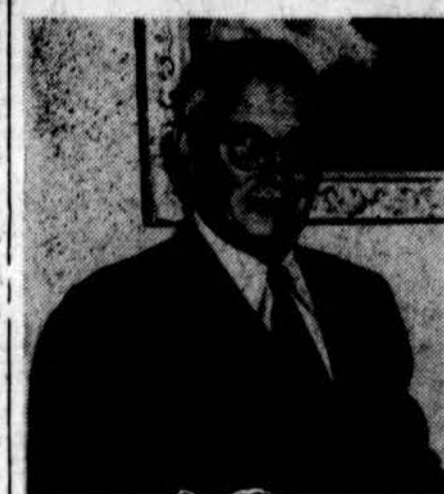
J. Pakel rezidencijoje, 123-144 So. Oak Park Ave., rytoj, 4 val. p.p., įvyks Dainų šventės plenumo ir visų komisijų svarbus pasitarimas.

× Tėvų Marijonų Seminarijoje kasamas maudymosi baseinas (swimming pool). Visi įrengiamieji darbai truks dvi savaites. Baseinas daromas tokio dydžio, kad jame galėtų maudytis 100 žmonių.