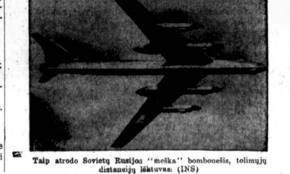
Taip atrodo Sovietų Rusijos „meška“ bombonešis, tolimųjų distancijų lėktuvas. (INS)

Jungtinių Tautų komanda turi duomenų, kad komunistai stiprina oro laivyną Šiaurės Korėjoje. O pagal paliaubų sutartį to neturėtų būti.