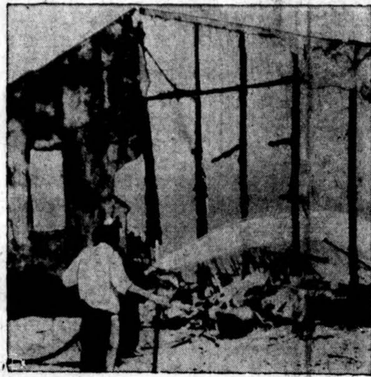
Vien tik griuvėsiai liko iš namo, kai graikai ir turkai susikirtė Kipro saloje.