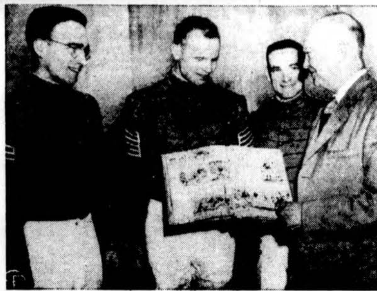
Prezidentui Eisenhoweriui West Point kadetai įteikia kopiją West Point metų knygu The Howitzer. (INS)