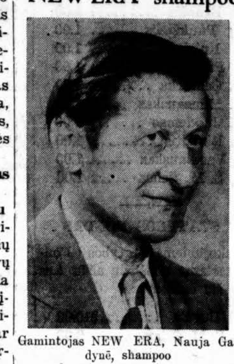
Gamintojas NEW ERA, Nauja Gadyne, shampoo

Nauja Gadyne — shampoo. Tai labai geras shampoo, kurį jis pats vartoja 40 metų — nei žilsta, nei plinka. Tas pagal specialią formulę pagamintas mišinys iš coconut alyvos ir jo išrastų priedų labai švelnina galvos odą. Siųskite $2.00 už 8 oz. bonką.