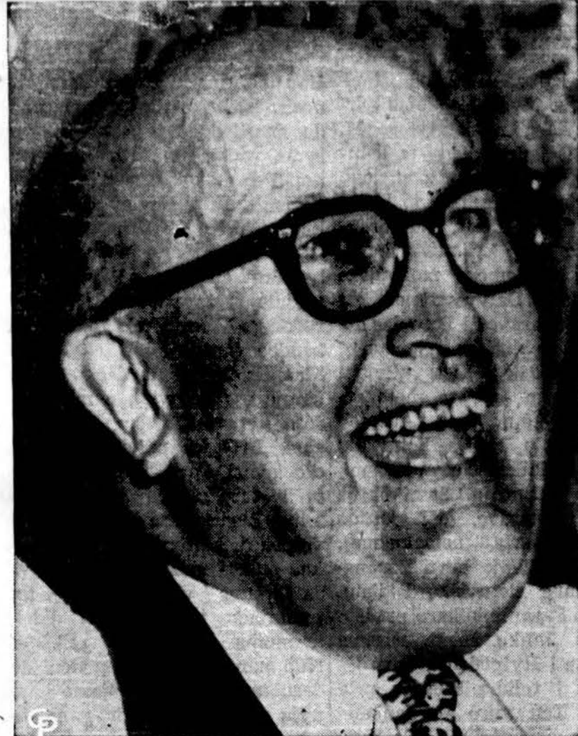
Spaudos klubo surengtuose pietuose Washington, respublikonų pirm. Leonard Hall pranašauja prez. Eisenhowerui ateinančiuose rinkimuose didelį laimėjimą. Po šio banketo Prezidentas susirgo.