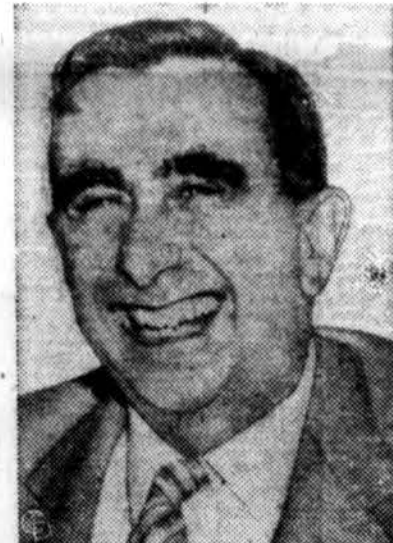
Dr. E. Teller iš Californijos universiteto per pokalbį su laikraščiu