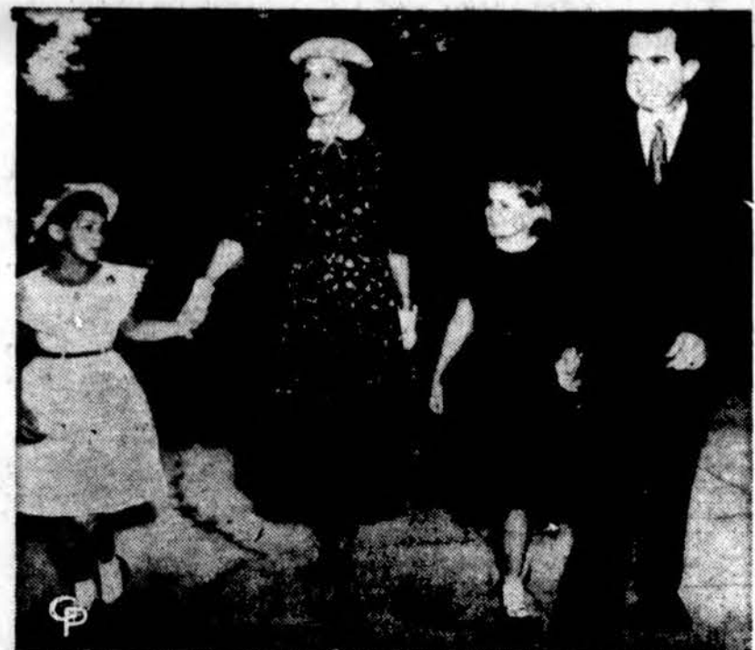
Viceprezidentas Nixon su šeima grįžta iš pamaldų, kur jis meldėsi už prezidento Eisenhowerio sveikatą. Nixon turi dvi dukreles — Julie ir Patricia.