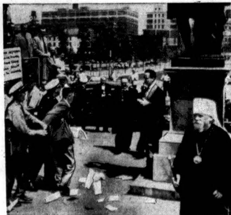
Policija suėmėsi vieną iš 200 demonstrantų, kurie pakėlė protesto triukšmą prieš Sovietų dvasiškių narius Philadelphiaje. Kada rusai atvyko į Independence Hall, protestuotojai juos sutiko su plakatais, šūkavimais ir protesto lapais.

„Mes turime vėl pabrėžti, kad mūsų tikslas buvo ir visados pasilikti — visiškoms mūsų tautų nepriklausomybės bei pilno suverenitumo atstatymams ir mes tikime, kad su Dievo pagalba Estija, Latvija ir Lietuva pasieks laisvę ir nepriklausomybę“ — baigia savo pareiškimą Pabaltijo diplomatinė atstovai.