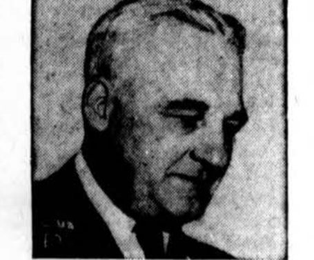
Gen Nathan F. Twining, važiuojantis į Maskvos oro demonstracijas.