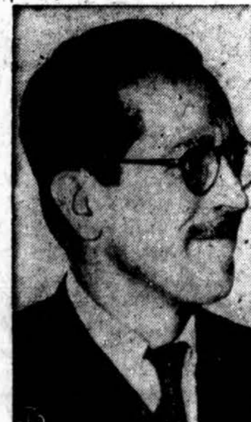
Siles Zuazo, naujasis Bolivijos iš narių miršta.

● Prancūzija pasirašė kontraktą dėl 110 greituųjų naikintuvų pasiuntimo Indijai.