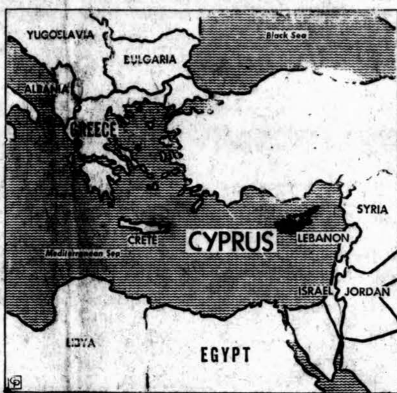
Pačių išrinkta vyriausybė, bet anglų gubernatoriaus ir jų kontrolė gyvybos, užsienių reikalų ir vidaus saugumo srityse yra planuojama Kipro salai. Toki planai yra ruošiami Londone. (INS)

Oras Chicagoje Oro biuras praneša: Chicagoje ir jos apylinkėse šiandien — giedra, aukščiausia temperatūra apie 85; žemiausia ketvirtadienio naktį virš 60.