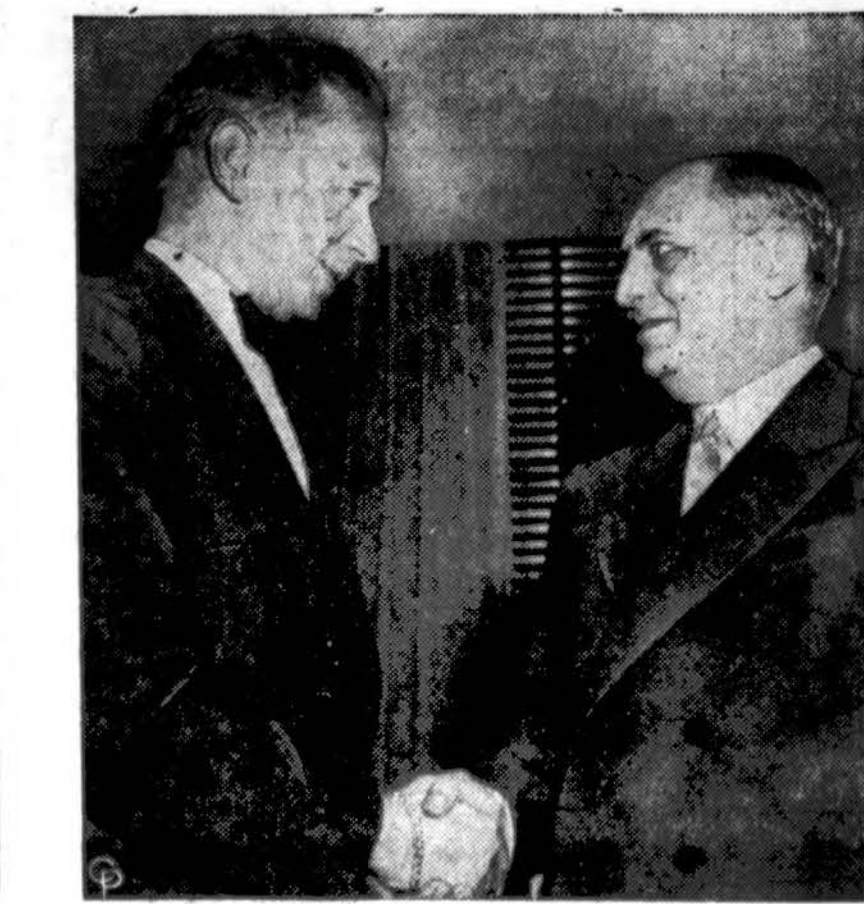
Jungtinių Tautų generalinis sekr. Dag Hammarskjöld (kairėje) sveikina nuolatinį Italijos atstovą J.T. ambasadarių Leonardo Vitetti. Hammarskjöld rytą išvyksta savo kelionėn už Geležinės Uždangos. Jis Maskvoje susitiks su Kremliaus vadais liepos mėn. 2 d.

— 25 Rusijos turistai, viešį Vokietijoje buvo nuvesti į naktinį klubą, kur jems parodytos neapsirengusios šokėjos. Jie po to išsireiškė: „Rusijos žmonės nesidomi tokiais dalykais“.