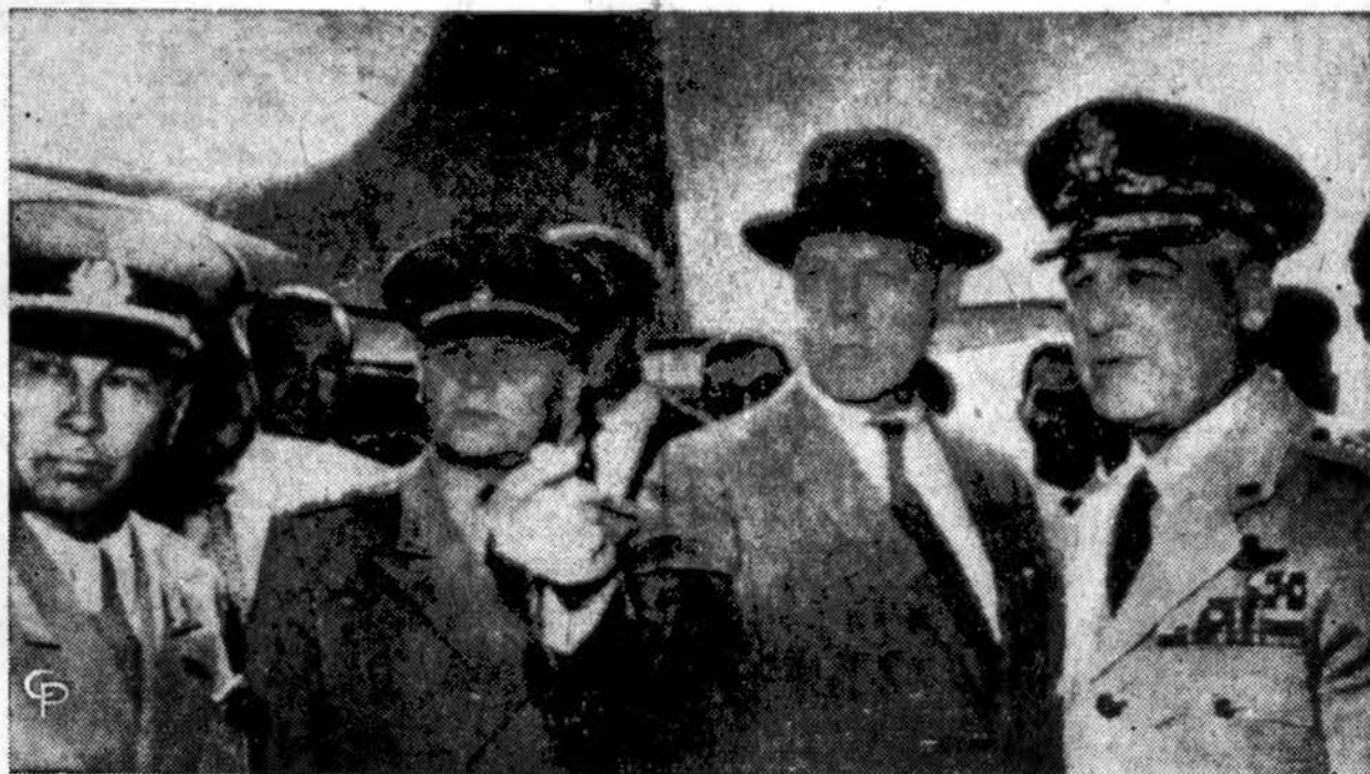
Gen. Nathan F. Twining (dešinėje) JAV valstybių oro pajėgų štabo vadas, atvykęs į Maskvos areodromą. Jį pasitiktė, stovi: (iš kairės) maršalas P. Žigarev, maršalas I. Konev ir JAV valstybių ambasadorius Charles E. Bohlen.

Oro biuras praneša: Chicagoje linai debesuota ir galima perkūri jos apylinkėse šiandien — danija su lietumi. Augščiausia temperatūra — apie 85, žemiausia naktį virš 60. Trečiadienį — giedra ir mažai pasikeitimai temperatūroje.