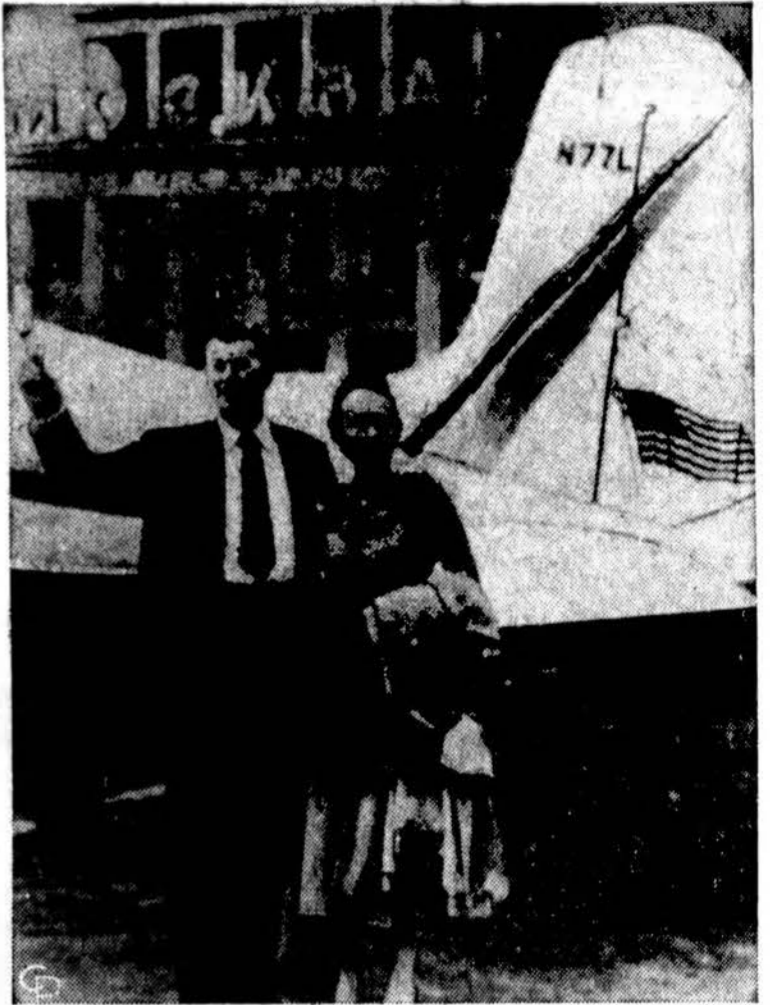
Amerikos fabrikantas W. P. Lear su žmona stovi Maskvos aerodro- me, kur jie nuskrido privačiu lėktuvu iš Rytų Beerlyno. Jie yra pirmieji keleiviai, kurie legaliai privačiu lėktuvu pasiekė Maskvą, nors navigatoriai ir buvo rusai.