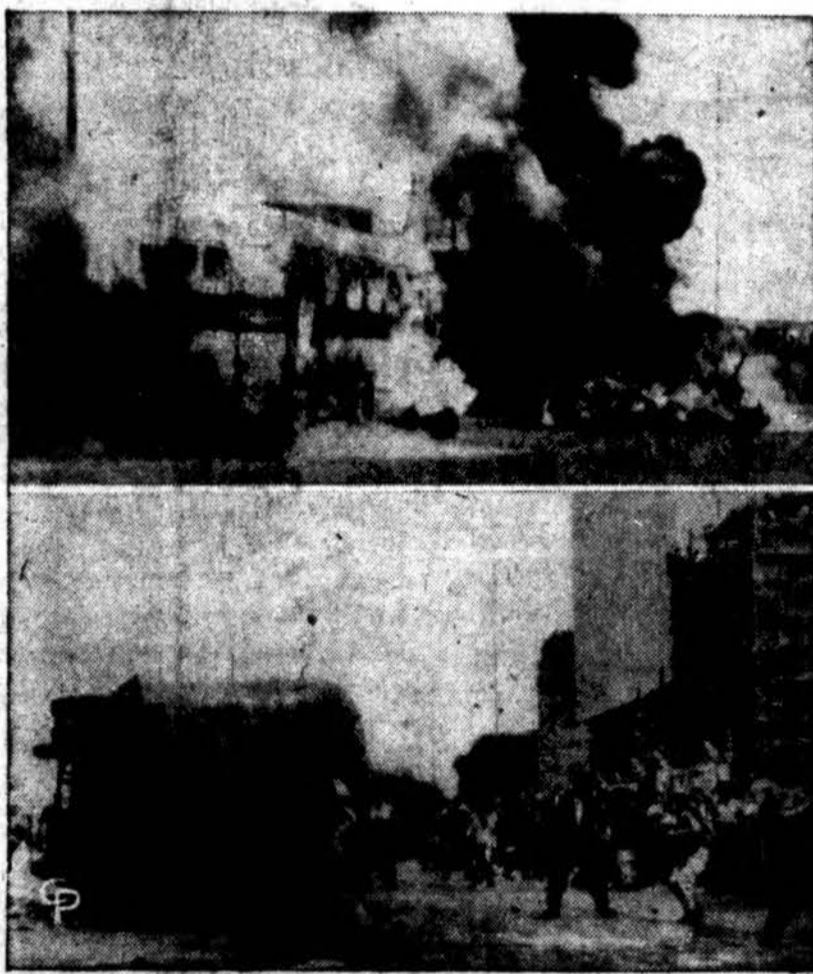
Maištininkai nerimauja Lima mieste, Peru valstybėje. Viršuje matosi padegtas autobusas, o žemai — kitas apverstas ir sulaužytas. Sakoma, kad šis įvykis atsitikęs pakėlus autobusų bilietų kainas.