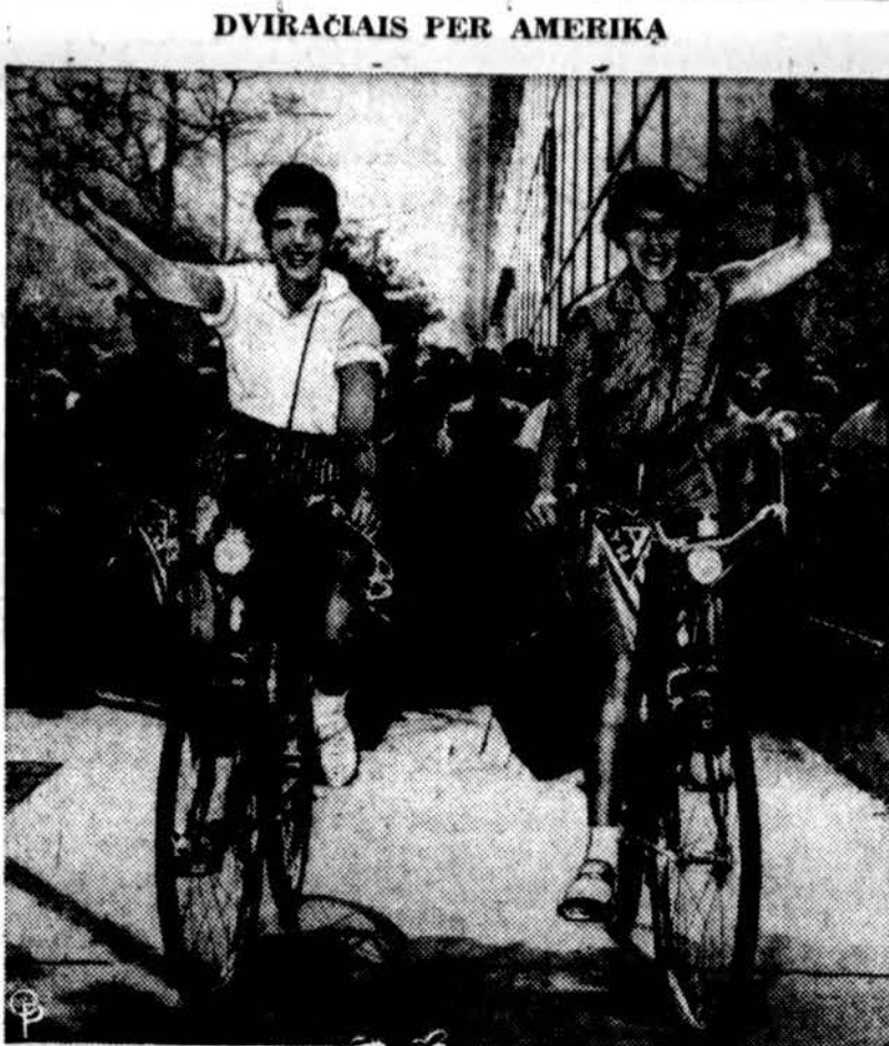
Dvi merginos iš New York City išvyksta dviračiais į Californiją. Iš ten jos tikisi pasiekti Havajus laivu ir toliau važiuoti dviračiu.