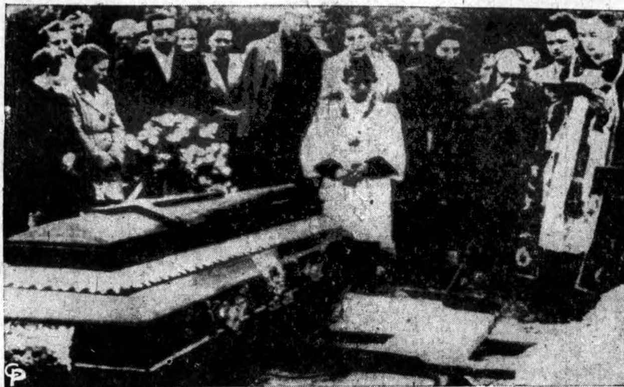
Poznanės sukilime žuvusiųjų giminės verkia prie kritusiųjų kapo, tuo tarpu kai kunigas (dešinėje) skaito laidotuvių maldas.