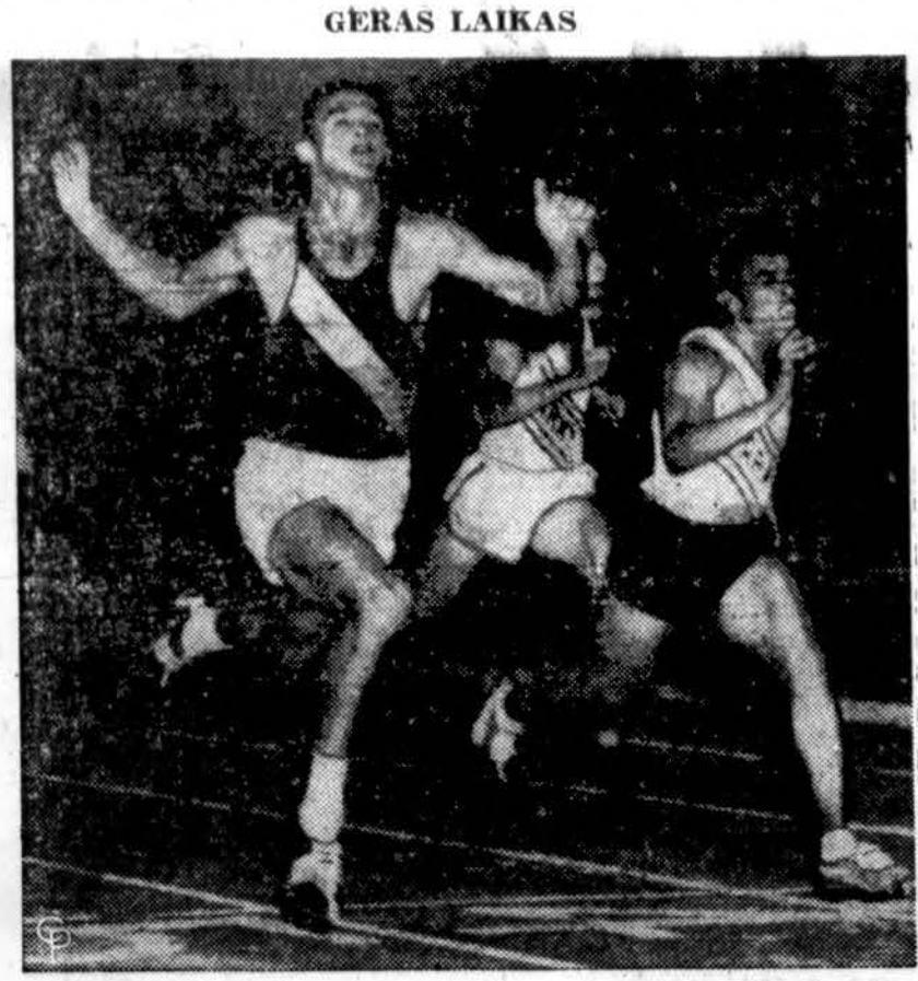
Bobby Morrow (kairėje) pasiekia finišą nubėgdamas 100 m. per 10.5 sek. Tai buvo prieš olimpinės rungtynės Los Angeles.

Po šių taip sklandžiai praė-jusių varžybų patenkinti tenis-ininkai išsikirstė, sakydami: iki pasamtymo Detroito! Bet čia kyla mintis, prisiminus pernyk-tes žaidynes Clevelande ir taip smarkiai didėjantį šios sporto šakos mėgėjų skaičių. Juk per-nai Clevelande, dalyvau jant 20 žaidėjų, a) vieneto baigmė įvy-