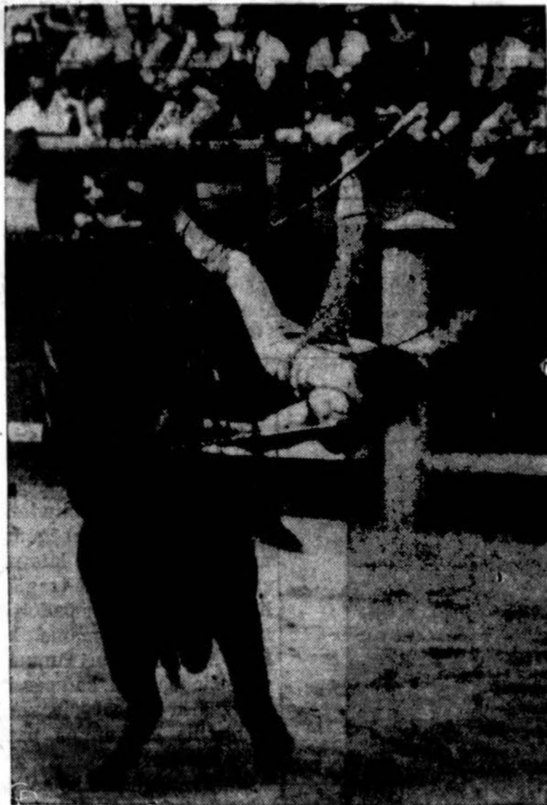
Madridė tereodorą jautis pakėlė ant ragų, tereodoras išmetė iš rankų kardą, kuris įlėkęs į publiką sunkiai sužeidė vieną žiūrovą.