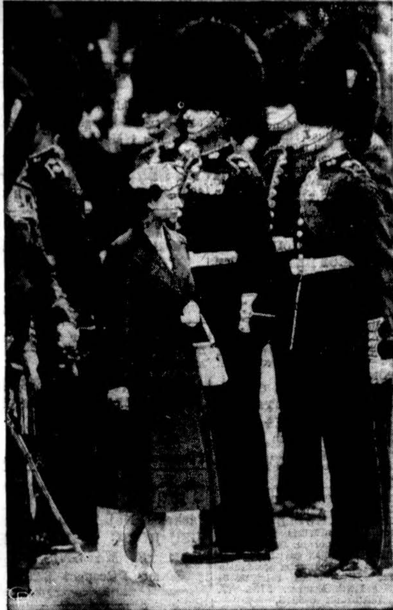
Karalienės Elzbiėtos sargybiniai Windsor pilyje, per 300 m. sukaktuvės.