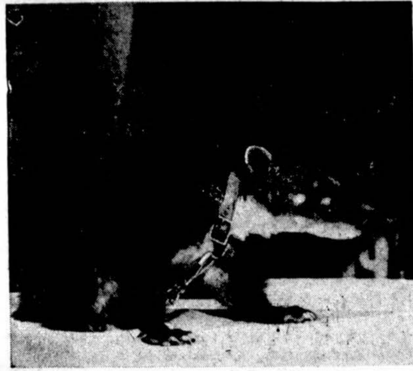
Liepos mėnesio gyvulių zoologijos sode išrinktas žvėrelis, vadina-mas Champ II, importuotas iš centrinės Amerikos.