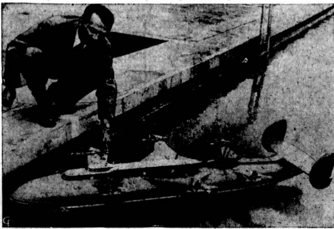
Malsheime, Vokietijoje, padarytas modelis laivo, kuris panašus į lektuvą ir kurį bus galima vairuoti radijo bangom.