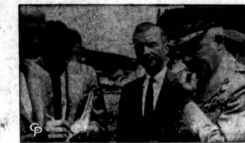
JAVValstybių oro pajėgų štabo vadas gen. Nathan Twining (dešinėje), sugrįžęs iš Sov. Sąjungos, laikraštiniams pasakoja įspūdingus patirtus tame krašte. Cia jį sveikina oro pajėgų sekretorius Donald Quarles (viduryje).

Leidinyje pateikiama sovietų klasingo įsibrovimo į Pabaltijo valstybes aprašymas, Vyriausiojo Lietuvos Išlaisvinimo Komiteto atsisaukimas į pasaulio lietuvių tragiškųjų deportacijų suaktyvėjimą ir visa eilė dokumentų, pavaizduojančių sovietinio okupanto nusikaltimus Lietuvoje ir kituose Pabaltijo kraštuose.