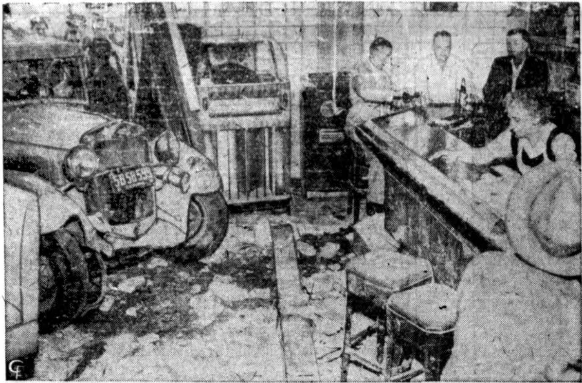
I smuklė, San Francisco mieste, įvažiavo 1930 m. Fordas, išverdamas duris, išvartydamas kolonas ir nubarstydamas tinką. Šoferis sako, kad neveikė stab džiai. Tačiau biznis toj smuklėj eina kaip paprastai.