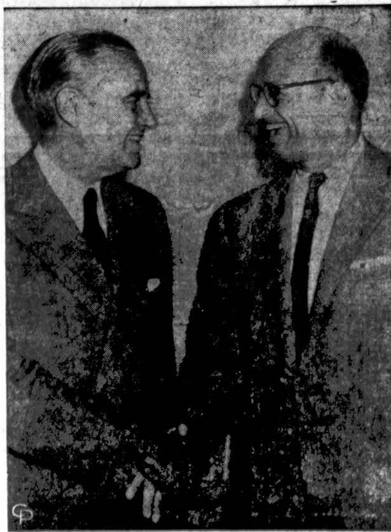
Gub. Averell Harriman (kairėje), siekiantis demokratų prezidentinės kandidatūros, Washingtono susitinka su rep. James Roosevelt iš Kalifornijos.