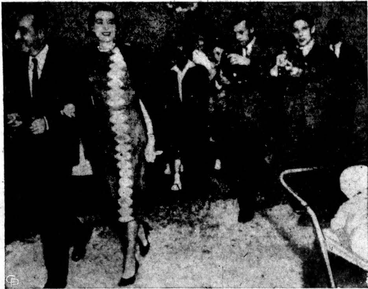
Rainier ir jo žmona Grace Paryžiuje buvo apsupti fotografų ir spaudos žmonių, kurie klausė ar princesė nelaukianti įpėdinio. Į tai ji atsakė, kad gandai.