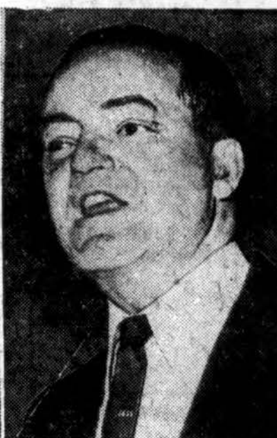
SEN. HUBERT H. HUMPHREY