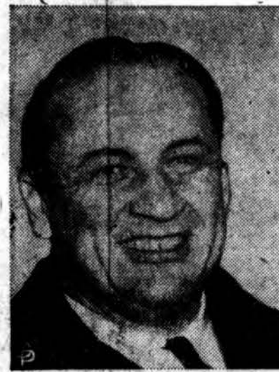
SEN. WILLIAM F. KNOWLAND