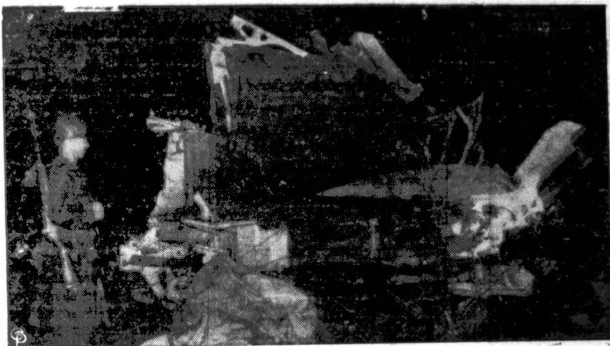
45 kariai žuvo, kai transporto lėktuvas nukrito netoli Fort Dix, N. J., tik pakilęs iš McGuire oro bazės. 21 keleivis sužeistas, daug iš jų kritiškai. Prie lėktuvo griaužė divi sargybinis.