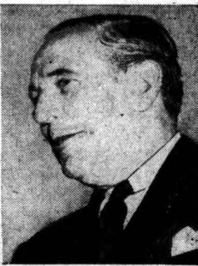
PAUL G. HOFFMAN

Prezidento Eisenhowerio nominuoti asmenys į Jungtinių Amerikos Valstybių delegaciją Jungtinių Tautų bendrojoje sesijoje: sen. William F. Knowland (R., Kalif.), sen. Hubert H. Humphrey (D., Minn.), Paul G. Hoffman ir Ellsworth Bunker.