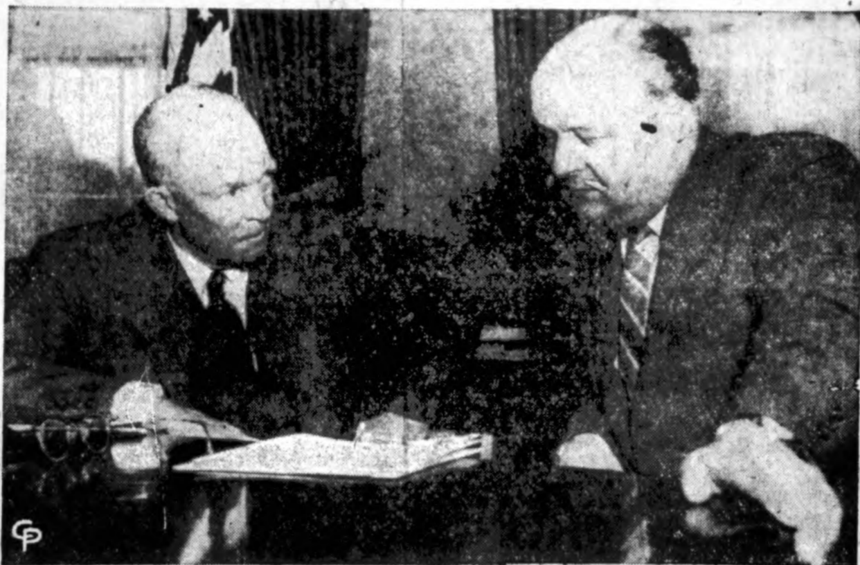
Civilinės apsaugos administratorius Val Peterson kalbasi su prez. Eisenhoweriu apie apsisaugojimą prieš priešų orinius puolimus. Washingtono tokių puolimų įsencinavimas ir evakuacijos bus vykdomos nuo liepos mėn. 20 d. iki 26 d.

• Rusija ir Izraelis susitarė pasikeisti prekėmis: vieni duos alyvą, kiti — citrinas.