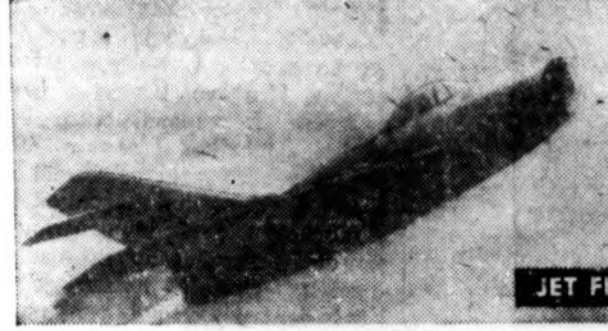
RUSSIA HAS 15,000