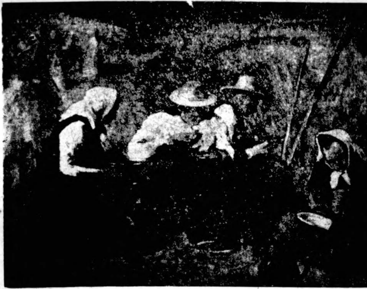
Kvėpia šilas įsirusiomis žemuogėm. Tū, tū, tū — tūtinuoja bitutė.

Texas universitetų Biocheminis institutas skelbia, kad per 20 metų žmogus suvalgo maždaug apie 20 tonų maisto. Iš to kiekio žmogaus organizmas tepasilaukia gal kokius 0,5%, o likusieji 99,95% — išmetami lauk.