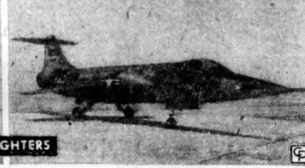
U. S. HAS 7,500

Kaip lentelėje matome, bolševikai turi daugiau bombonešių ir kovos lėktuvų. (INS)