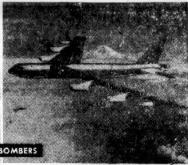
U. S. HAS FEWER THAN 100