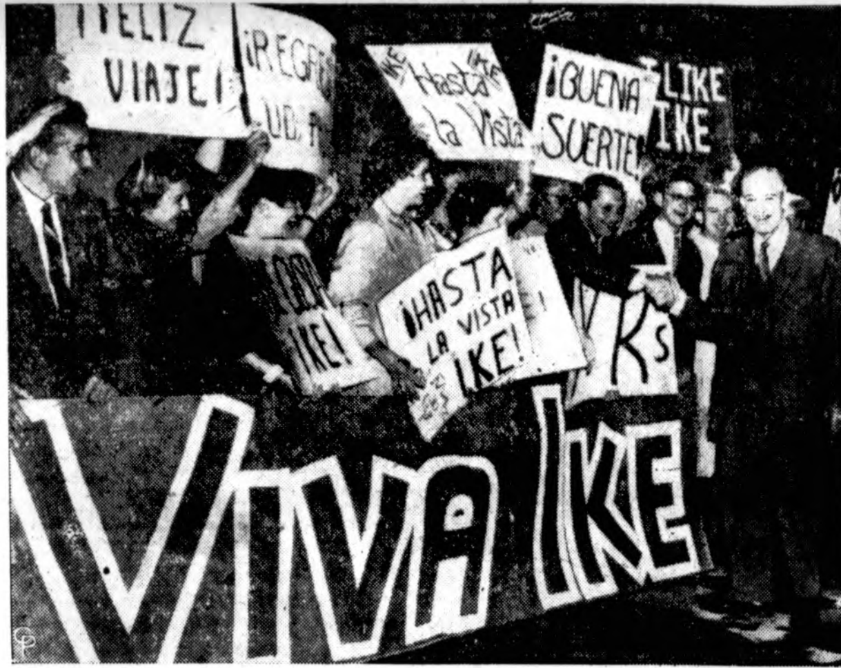
Jauni respublikonai su ispaniskais šūkiniais palydėjo prezidentą Eisenhowerį iš Washingtono aerodromo į Panamą.