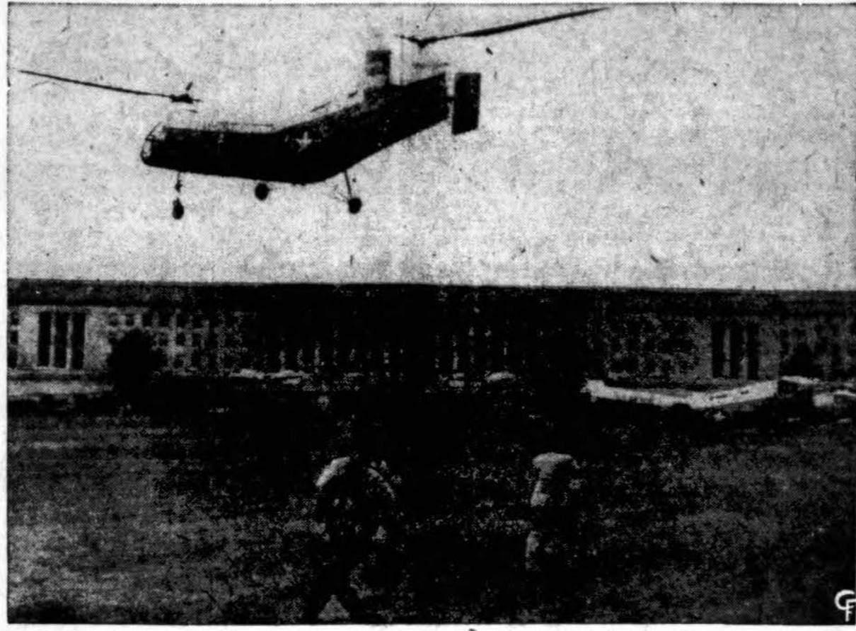
Prezidentui Eisenhoweriui bandymo tikslams paskelbus "Unlimited National Emergency and State of War" deklaraciją, armijos helikopteriai iševakuavo visus vyriausybės pareigūnus į tolimesnes nuo sostinės sritis.

Siandien dedikuojant šią "Lithuanian Plaza" mes pasižadėjome sudvigubinti savo pastangas atstatyti laisvę žmonėms, nežiūrint kur jie būtų. Lietuvos žmonių panašiomis pastangomis turtinga istorija, gali mums suteikti daug dėkingų motyvų.