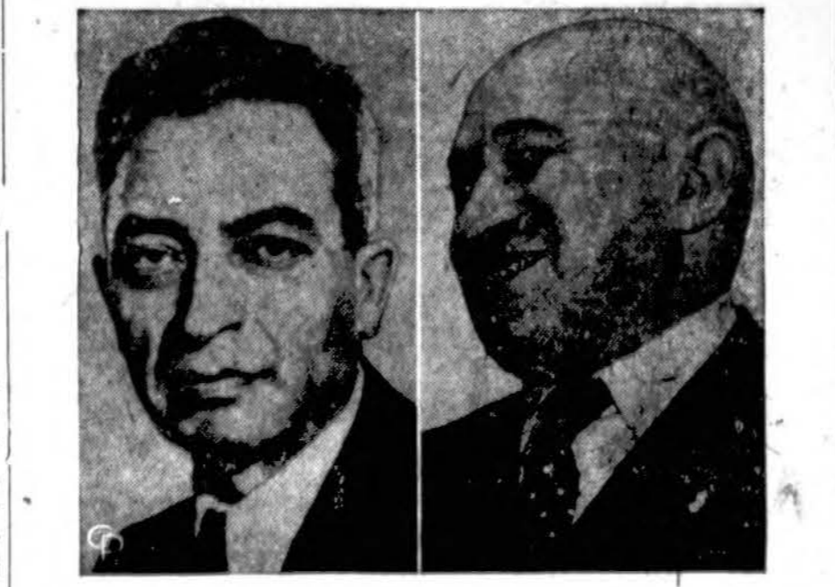
Naujasis Vengrijos komunistų partijos bosas Ernest Geroe (kalbėjo), kuris užėmė Staline pasekėjo Matya Rakosi vietą.