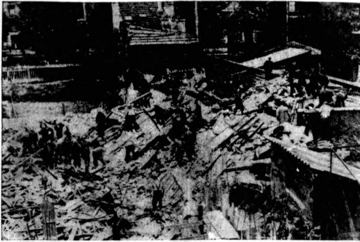
Sugriuvus St. Fiace hoteliui Paryžiaus miesto St. Denis kvartale, gavosi paveiksle matomas klaidus vaizdas.

● JAV Kongreso daugumos lyderis McCormack ir mažumos vadas Joseph Martin, Jr. pasisakė revoliuciją, kuria reikalaujama lygių teisių lenkams Lenkijoje. Rezoliucija buvo priimta vienbalsiai.