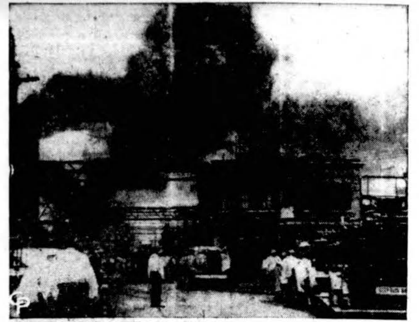
Sunkūs dūmai kyla iš susprogiusio chemijos fabriko Ningara Falls, N. Y., kur sprogiimo metu žuvo 5 asmenys ir 6 sužeisti.

Drama televizijoje Katalikų universiteto iškalbos NBC televizijoje tinklas savo programon rugp. 8 d. nuo 8 iki 9 val. paskelbė Roberto Cre-an dramą. Autorius yra baigęs Standard".