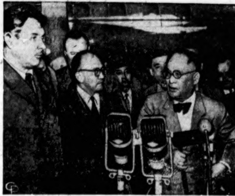
Japonijos užsienio reikalų ministeris Mamoru Shigemitsu, lėktuvu atvykęs į Maskvą tartis dėl II Pas Karo taikos sutarties pasirašymo. Jo kairėje stovi Sov. Sąjungos užsienio reik. min. Dimitri Sepilovas.

• Jungtinių Tautų Saugumo Taryba , 10:0 balsais, patvirtino nacionalistinės Kinijos priėmimą į Tarybos sudėtį. Balsuojant, Burma ir Indija susilaikė.