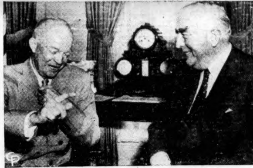
Prezidentas Eisenhower susitinka Australijos min. pirmininką Menzies, Abu kalbėjo ir apie Suez kanalo krizę, tačiau smulkmenų neskelbė.

miestas per porą metų pralenks gyventojų skaičiumi Chicago, o kiek vėliau ir patį New Yorką.