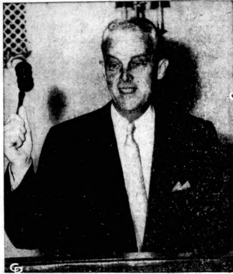
Demokratų tautinis vadas Paul Butler jau yra atvykęs į Chicago ir turi pasitarimus su kitais demokratų konvencijos rengėjais, kuri čia prasidės po savaitės laiko.