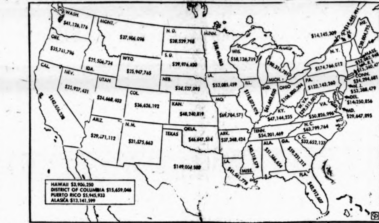
Čia pažymėti skaičiai parodo kiek kuri valstybė gaus pinigų iš bendros kongreso priimtos viešelių fondo 2,500,000,000 dol. sumos. Šios pajamos bus pradeda mos naudoti sekančių metų liepos mėn. 1 d.