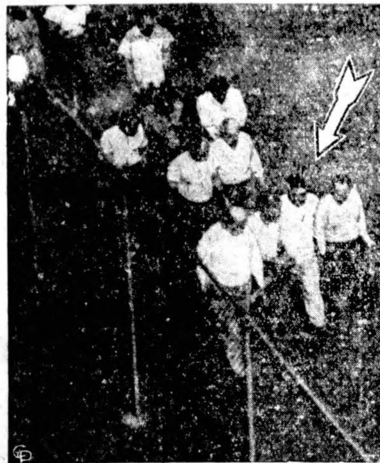
Nuotraukoje matyti keturi iš devynių plėšikų, kurie išplėšė Bostone banką išnešdami 1,000,000 dolerių.