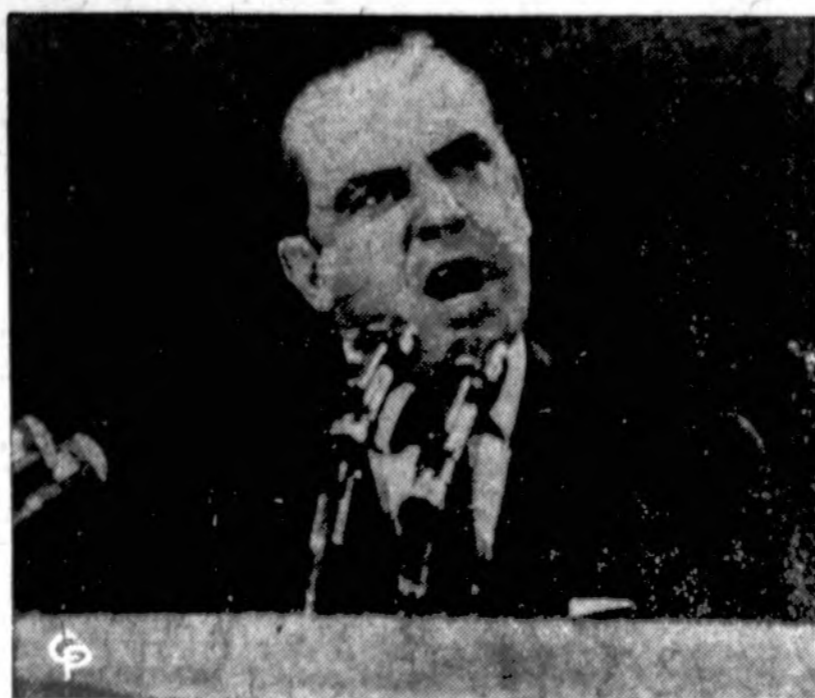
Demokratų pagrindinis kalbėtojas Frank C. Clement emociškai kalba konvencijos metu Chicagoje. Čia jis stipriai atakavo respublikonus, o ypatingai viceprezidentą Nixoną.

• Tunijoje apvirto sunkvežimiu su 40 darbininkų ir nelaimės metu žuvo 8 asmenys, o 27 buvo sužeisti.