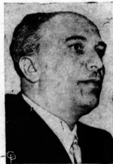
Italijos krikščionių demokratų partijos sekr. Amintore Fanfani, kuris užsienio spaudoje klube New Yorke kalbėjo Suez kanalo klausimu.

Knowland pirmadienį su prez. Eisenhoweriu Baltuose Rūmuose praleido 30 min. Jis taip pat užtikrino, kad respublikonų konvencijoje Kalifornijos delegacija pasisakys už Eisenhowerį — Nixoną ir jie lapkričio mėn. rinkimuose laimėsį pakankamą daugumą.