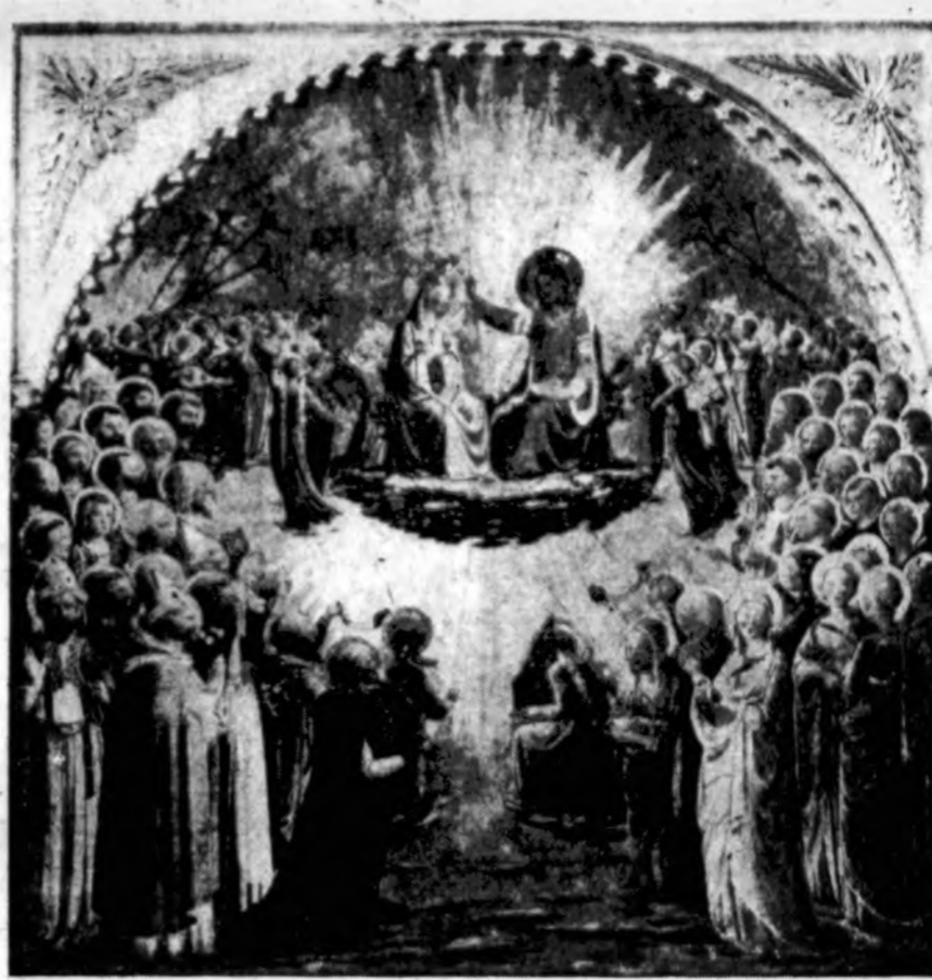
šv. P. Marijos apvainikavimas Berto Angelico kūriny