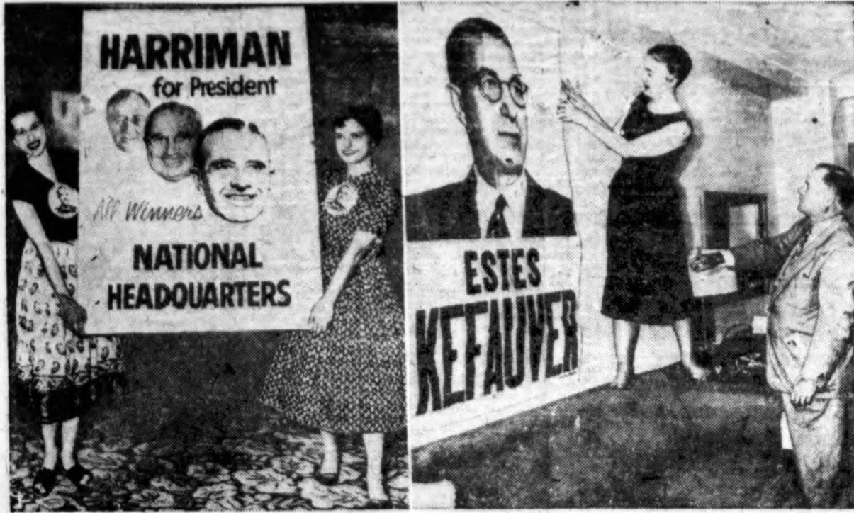
Buvęs prezidentas Trumanas pasisakė už kandidatą į prez. Harriman. Jeigu savo balsus atiduotų nuo kandidatūros atsiskakę Kefauver Stevensonui, tada pastarajam padėtis labai pastaisytu.

Kuo pasižymi Wisconsin Dells vasarvietė, sutraukianti tiek daug vasarotojų? Pirmoji eilėje — graži gamta, sausas oras, maudymosi ir apsigyvenimo galimybės. Tačiau po 2 — 3 dienų poilsio vasarotojas jau įsijaučia vėlavimą. Va, čia vasarvietė yra išsprendusi didelę problemą, su-