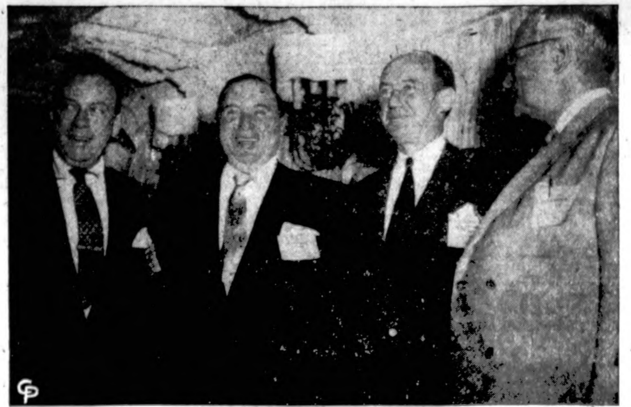
Kartu pusryčiauja demokratų konvencijos metu New Yorke majoras Richard Wagner, Chicago's Richard Daley, pilnas vilties Adlai Stevenson ir buvęs prezidentas Harry Truman.