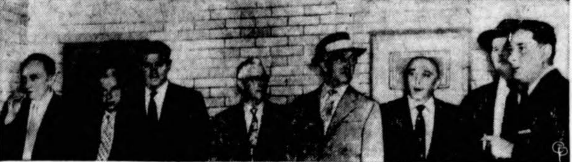
Išplėšė 1,200,000 dol., Bostono banka, plėšikai teisiami teismo. Čia matyti visa jų grupė, išskyrus vieną, kuris mirė nepagautas.