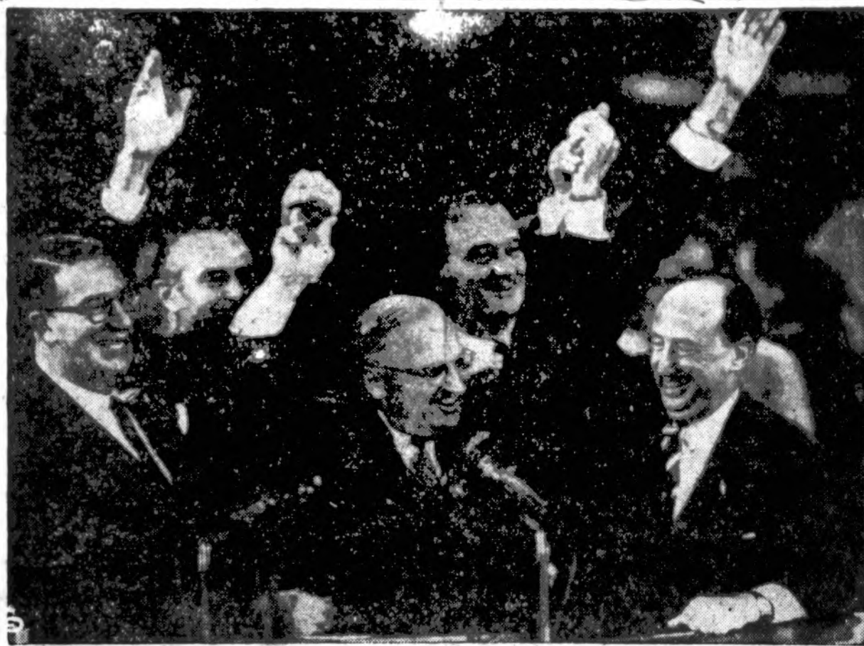
Penki pagrindiniai demokratų partijos žmoņės: Harry Truman, Estes Kefauver (kairėje), Adlai Stevenson (dešinėje), Averell Harriman ir Lyndon Johnson pasirodo demokratų partijos konvencijoje Chicagoje.

Šioje konvencijoje pastebime taipgi kitą įdomų reiškinį. Pir-