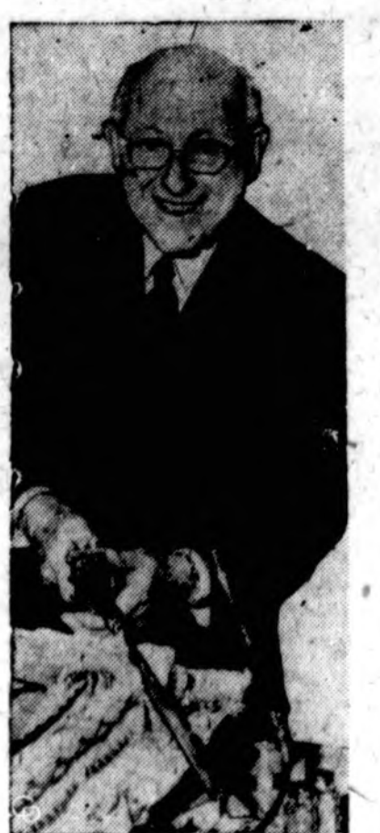
Filmų gamintojas DeMille šventė 75 m. amžiaus sukaktį, Hollywood, Calif. Jis pjauna tortą su kardu vartoto "The Ten Commandments" pastatytoje.