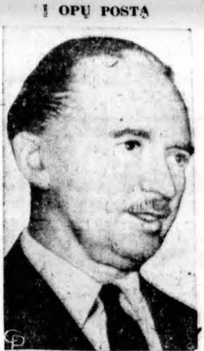
I labai opų postą, ambasadorium į Egiptą, paskirtas R. A. Hare, 55 m. Jis yra dirbęs užsieniuose nuo 1927 m. Jis pakeis dabartinį ambasadorių H. A. Byroade.