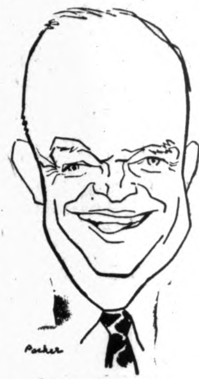
Dwight D. Eisenhower

• Viena trečioji iš 135,000 birželio mėnesyje Anglijoje viešėjusių svetimtaučių turistų buvo amerikiečiai.