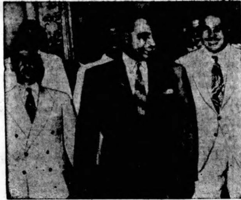
Egipto diktatorius Nasser šypsosi žurnalistams, sekantiems Kaire vykstančią konferenciją dėl Suez kanalo.