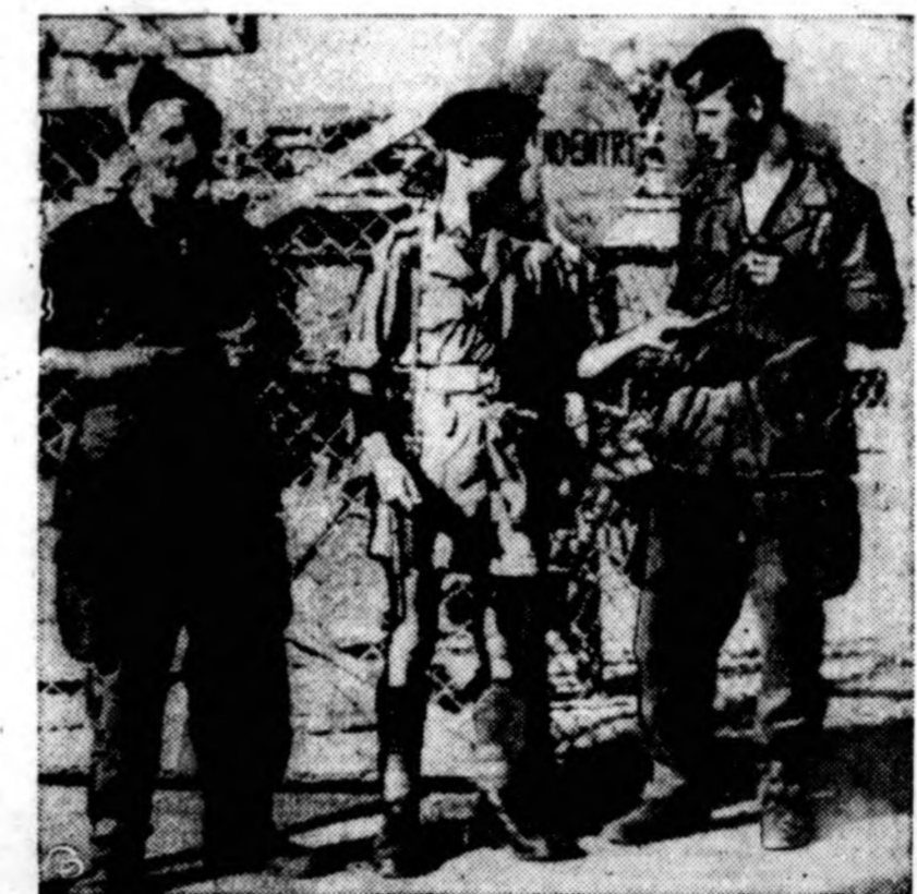
Britų parašūtininkas Kipro saloje duoda cigaretę prancūzų kareiviui, kai kitas valgo vyvnuogę. Britams pritarus, Prancūzijos kariuomenės daliniai atvyko į Kiprą ryšium su Suez kanalo krize. Prancūzų kareiviai stovi Famagustoje, Kipro saloje.

Gynybos ministerija taip pat pranešė, kad Vak. Vokietija pirkis už 1½ biliono dol. Amerikos ginklų ketverių metų laikotarpyje.