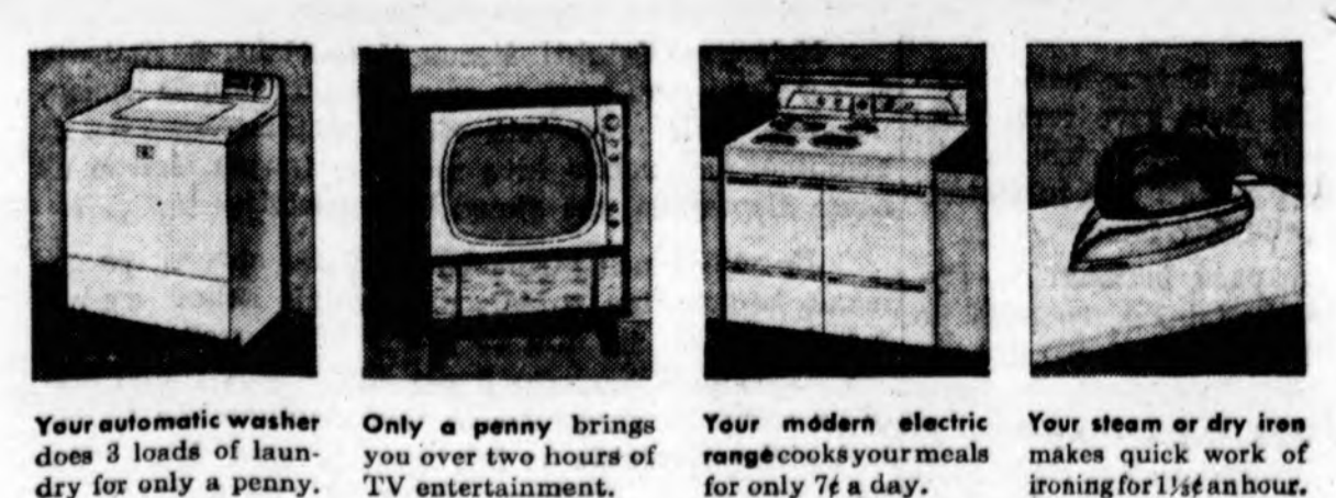
Your automatic washer does 3 loads of laundry for only a penny. Only a penny brings you over two hours of TV entertainment. Your modern electric range cooks your meals for only 7¢ a day. Your steam or dry iron makes quick work of ironing for 1¢ an hour.

Commonwealth Edison Public Service Company