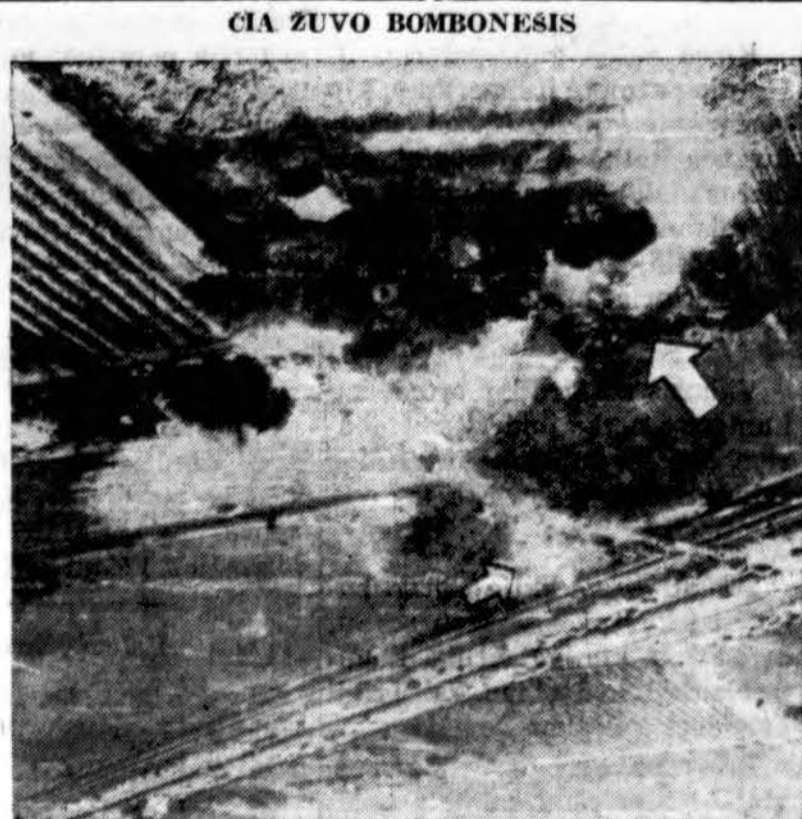
Sprausminis bombonešis B-52 nukrito Maderoje, Calif. prte Southern Pacific geležinkelio linijos į vienos farmos sodybą. Lėktuvas užsidėgė ore. Penki lakūnai žuvo ir 2 sužeisti. (INS)