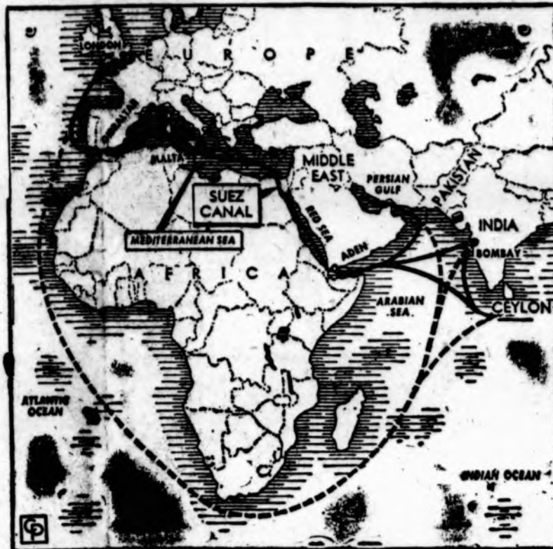
Žemėlapis palygina ilgą, ilgą kelionę iš Anglijos aplink Afriką į Indiją su trumpesniu keliu per Suezą; važiuojant aplink Afriką susidaro daugiau kaip 5,900 mylių kelio. Plaukiant laivams aplink Afriką sudaro 12,374 mylių kelio, o tuo tarpu per Suezą — 7,117 m. Afrikos kelias galbūt bus naudojamas, jei Egiptas užkirs kelią per Suezą „naudotojų sąjungai“, kuri nori turėti savus laivo pilotus.

— Bombėjuje, Indijoje, prieš vakariečius nusiteikę indai bandė sukelti demonstracijas prieš britus, bet demonstracija nepavyko. Tik 30 asmenų pasirodė su plakatais už Egipto prezidentą Nasserį.