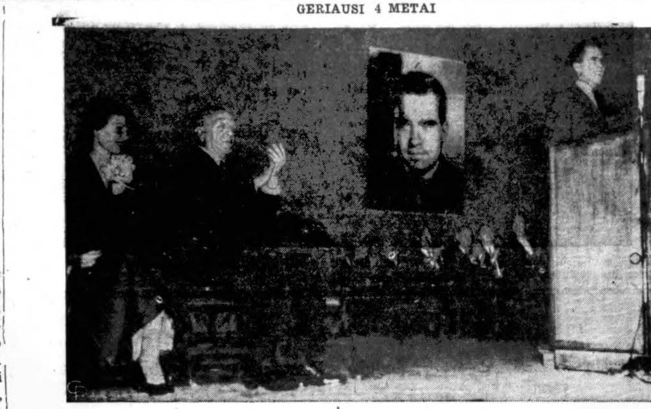
Viceprez. Nixon kalba perrinkimo kampanijoj savo namų mieste Whittier, Calif., sakydamas, kad pastarieji 4 metai buvo Amerikoje patys geriausi.

Jieškos pasauliečių misionierių Katalikų studentų misijų sąjūdyje, kuris senesniai tarėsi savo 17-me suvažiavime, nutarta stengtis įtraukti pasauliečius vyrus į talką misijoms. Numatoma įkurti tam reikalui specialią organizaciją.