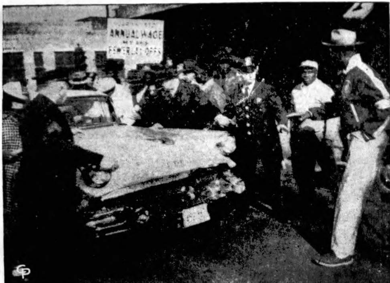
40 mėšos apdirbimo skyrių Swift kompanijos streikavo. Streikuoja 25,000 darbininkų, jų tarpe 4,000 Chicago skyriuose. Čia matyti piketuotojai prie Chicago jonių.