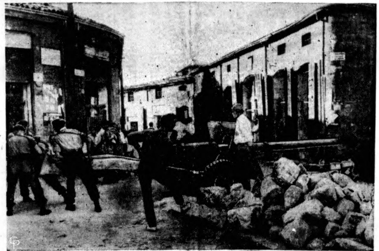
Britų kariai pastatė prieštankinį ginklą Nicosia mieste, Kipro saloje. Kipro saloje padėtis pablogėjo, kai britai pakorė tris graikų kipriečių pagrindžio (Eoka) narius.

Tada vakariečių dauguma, turima Saugumo taryboje, susidurs su kieta, akmenine sovietiško veto siena kiekvieną kartą, kada tik bus siūloma kokia akcija, ja ar bausmė prieš Egiptą... (J. Pr.)