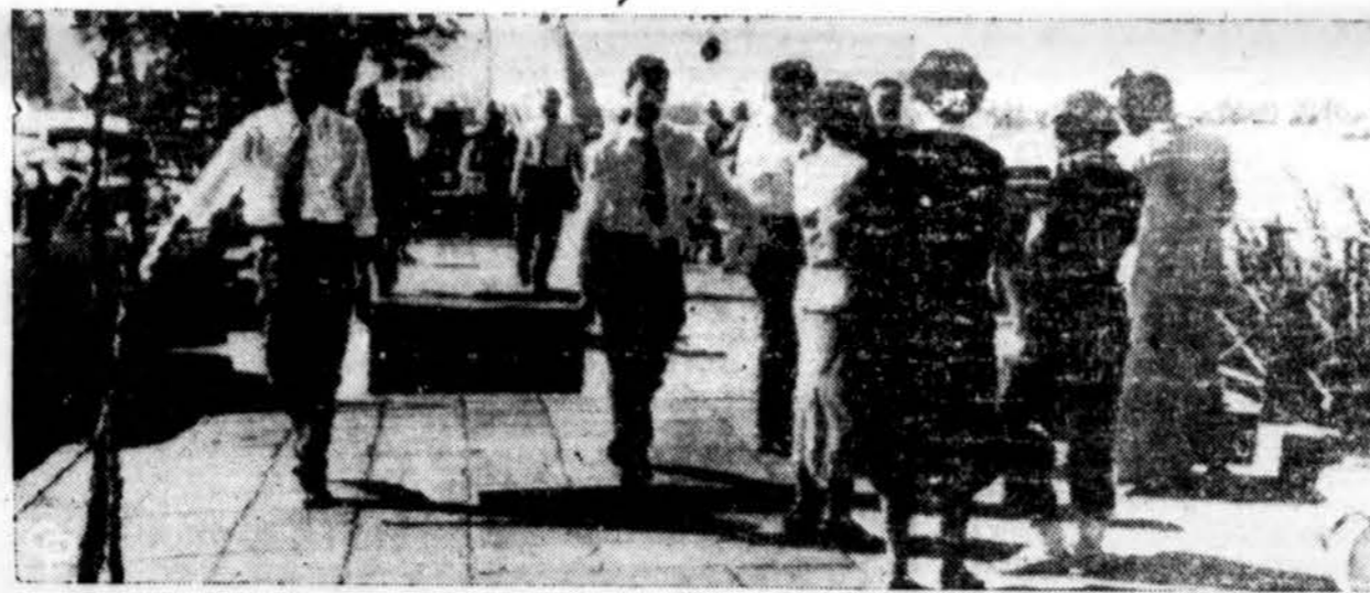
Amerikos piliečiai bėga iš Kairo.

Tačiau, perimdama reikalus iš buvusių bendruomenės organų, Taryba laiko savo pareiga konstatuoti ir pranešti lietuviškosios visuomenės žiniai, kad Vasario 16 gimnazijai vis dar tenka kovoti su gyvybiniais sunkumais. Ši švietimo institucija, teikianti laisvojo pasaulio lietuvių bei pareigą tarti visiems laisviesiems broliams ir sesėms —