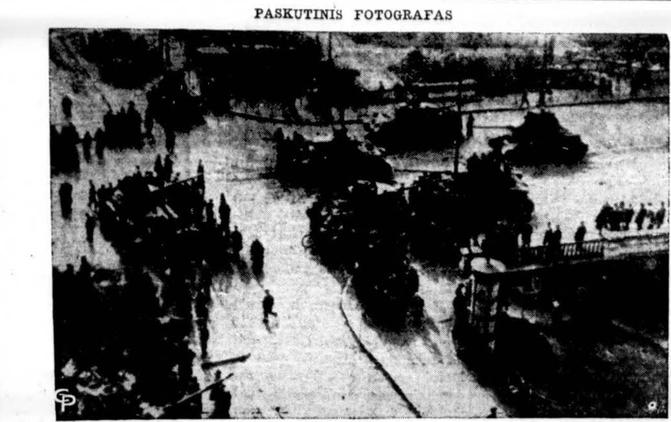
Vienas iš paskutinių fotografijų išvyksta iš Vengrijos kada sovietų tankai užėmė Budapeštą ir kitas vietas, kuriose daugiau pasirodė sukilėliai.

BRUNO'S KEPYKLA 3339-41 S. Lituania Ave. Tel. Offiside 4-6376 Pratatomė į visas krautuvas ir restoranus, taip pat į studentų ir visus artimuosius miestus.