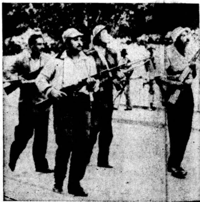
Egipto civiliai kareiviai saugo Ismailiją karo pailiųjų metu. Ismailija yra Suez kanalo vidurkyje.