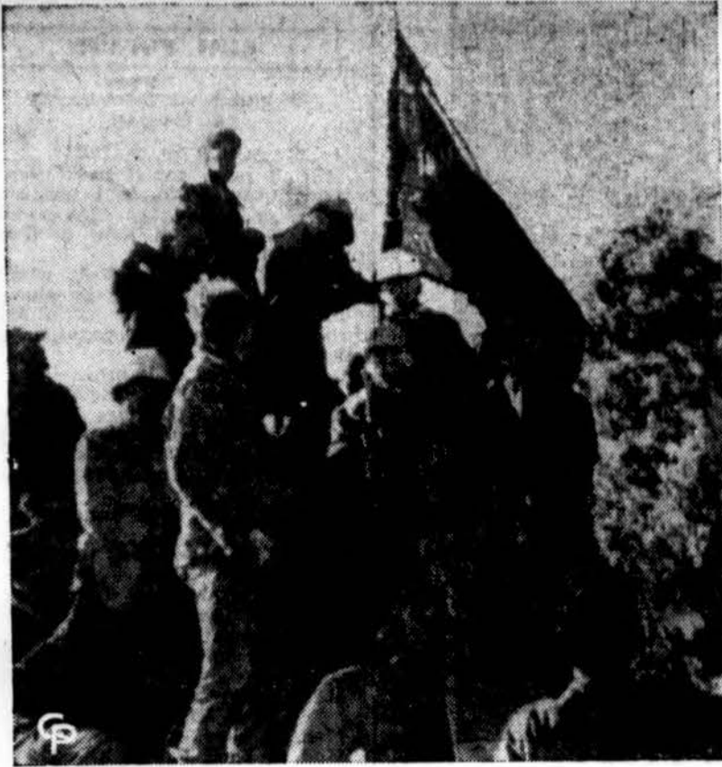
Izraelio trupė džiaugiamosi kelia savo vėliavą Suez kaimo zonoje. Antroji grupė stebi britų parašutininkus.

Worcesterio skautų vyčių dr. Vinco Kudirkos būrelis ruošia šokių vakarą lapkričio 17 d. 6:30 val. vak. Maironio Parke, Worcester, Mass.