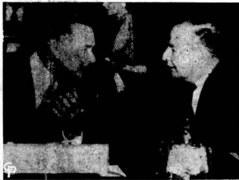
Henry Cabot Lodge (kairėje), JAV ambasadorius Jungtinėse Tautose, kalbasi su Britanijos užsienio reikalų ministru prieš eidami į Jungtinių Tautų generalinę asamblėjos posėdį, kuriame pirmenybė suteikta Vengrijos klausimui. Lloyd pareiškė, kad Sovietai bijo viešų debatų Vengrijos klausimui.

Oro biuras praneša: Chicagoje ir jos apylinkėse šiandien — dalinai apsiniaukę ir šilčiau, rytoj — mažas pasikeitimas oro temperatūroje.