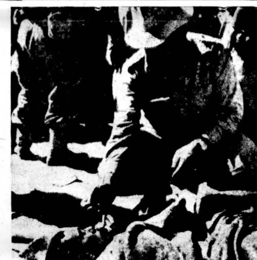
Kur tai Sinai pusiaulyje Izraelio kariuomenė uždega cigarete sužeista-jan egiptiečių karivini. Sužeistieji buvo nugabanti į ligonines ir ten jiems buvo suteikta pagalba, kai kovos aprimo.

lylavęs posėdžiuose, konferen cijose, pobūviuose ir visur, kur tik buvo kalbama įkurdinimo klausimais. Dar nespėjęs to ju sušilti New York, kan. Kon čius jau rengėsi vykti į Washing toną ir tenai pradėti kelius, norint padėti Amerikon atvykti TB ligoniams, kurie dėl tos sa vo ligos buvo perskirti su še imomis.