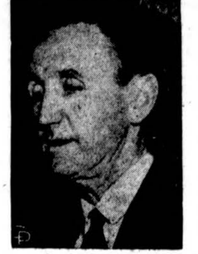
Vienas iš lyderių senate demokratų partijoje bus sen. Mike Mansfield, Montana.