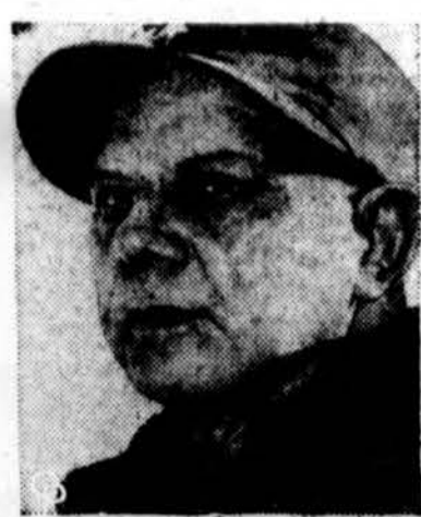
Adm. George Dufek

Miškų produktų sekcija. Kaip bendrai visa pramonė, taip ir medžio pramonė JAV stovi labai augtam lygy. Apskaiciuojama, kad apie 5,000 atskirus pavadinimus turinčių produktų pagaminama iš medžio, ji apdir-