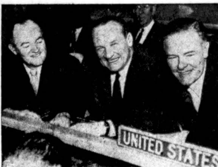
JAV vyrai Jungtinėse Tautose. Iš kairės, sen. Humphrey (D), Minnesota, sen. W. Knowland (R), California, ir H. C. Lodge.

MASKVA, lapkričio 18. — Informuoti šaltiniai praneša, kad maršalas Konev, atstatytą lenkų gynybos min. maršalą Rokossovsky paskyrė Varšuvos pakto karinių jėgų vadu. Varšuvos pakto priklauso Rusija, Rytų Vokietija, Cekoslovakija, Lenkija, Vengrija, Bulgarija, Rumunija, Albanija.