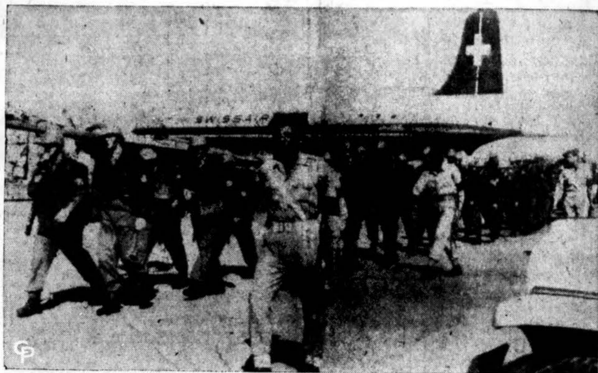
Pirmieji Jungtinių Tautų policijos daliniai, atvykę į Egiptą, žygiuoja į būstinę netoli Abu Suweir aerodromo. Juos lydi egiptiečių kareiviai (juodomis kepuraitėmis).